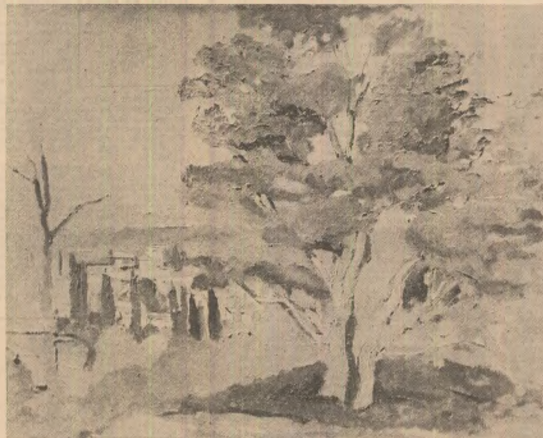
„Statornicie” — ulei de Benone Suvăilă