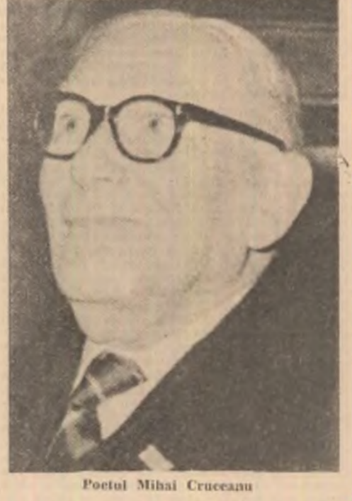
Poetul Mihai Crețeanu