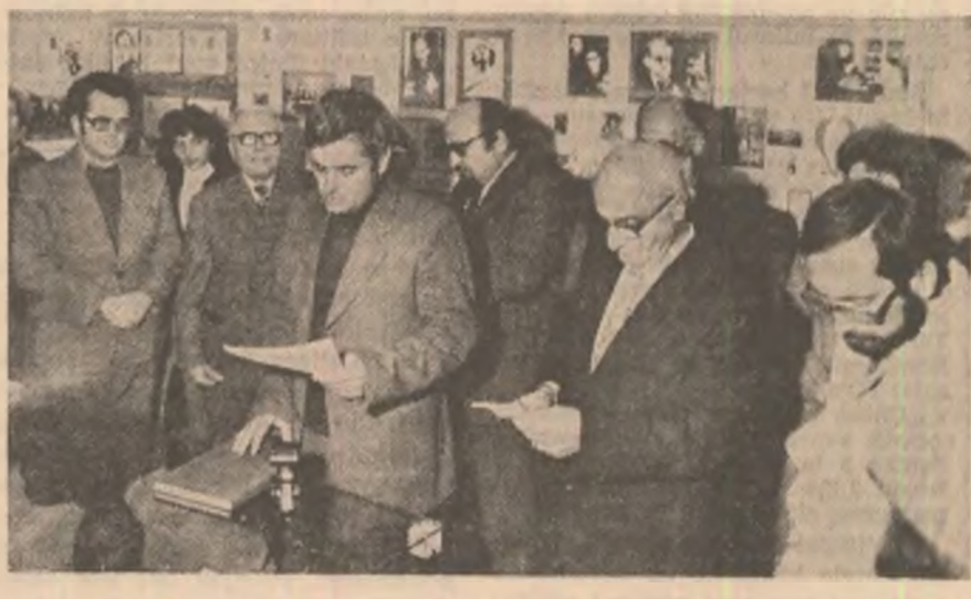
Evocare în Expoziția memorială cu caracter permanent Perșescius