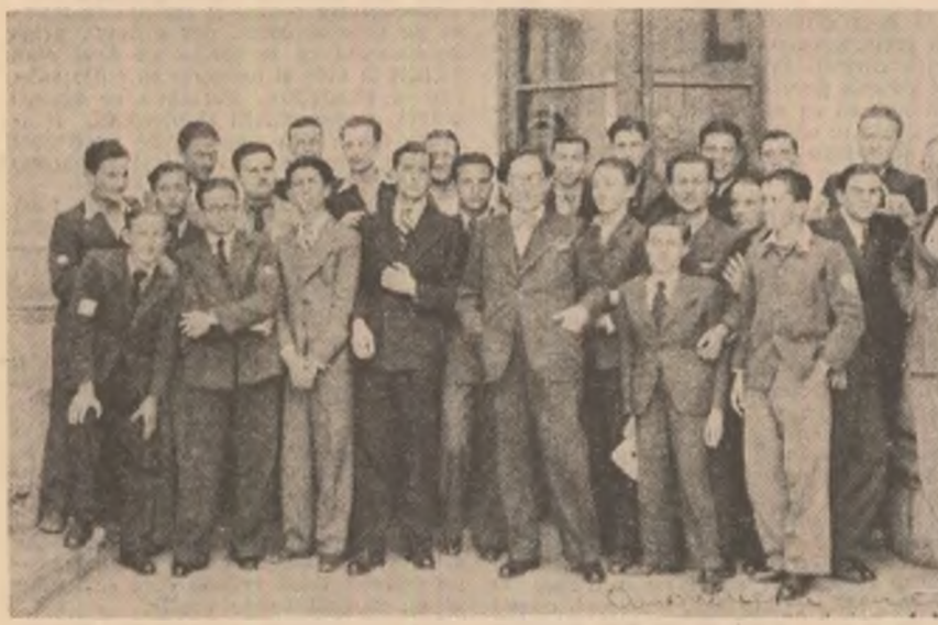
Perpessicius într-un grup de elevi

se numesc Elapa, Sadoveanu, Argeșii, Călinescu, Vinu, Bacovia... Ei sînt aici, cu cărțile lor, pipăite de ei în clipa scrierii dedicațiilor. Sute de cărți cu dedicații, Domnule, Maestre Perpessicius, aceste uriașe, aflate în jurnalul Dumneavoastră și Dumneavoastră aflat în fața mea, mă faceți să-mi pădăresc poziția dragă mie, cea dreaptă, și să mă prosternez.