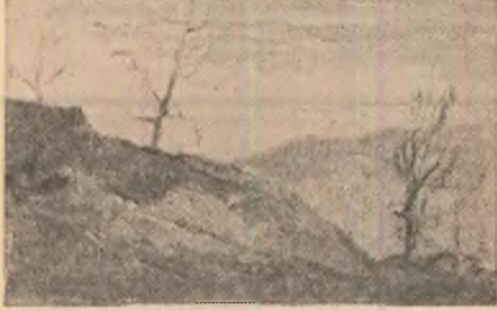
Benone Șuvăilă : „Peisaj”