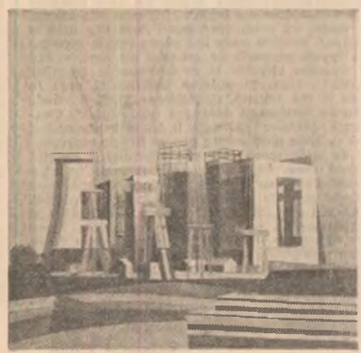
Spiru Chintilă: „Șantier”