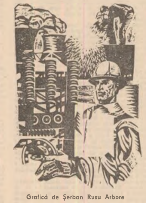
Grafică de Șerban Rusu Arbore