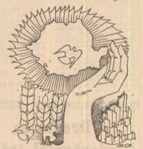
Desen de Marian Avramescu