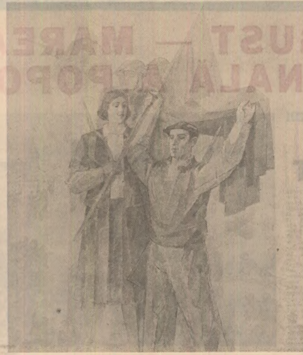
23 August 1944 — Pictură de Etimie Modică