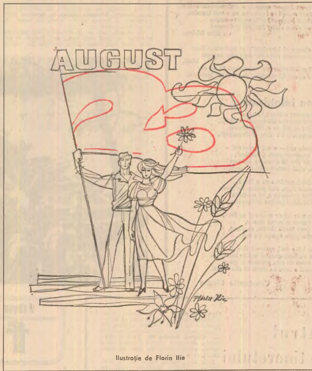
Ilustrație de Florin Ilie

Și vedem ce spun cifrele. Raportăm, în 1965, o producție industrială de 17 ori mai mare decît în 1944. Astăzi raportăm o creștere a acestei producții de peste 100 de ori față de anul unu al revoluției. Astăzi, în numai 60 de zile, realizăm întreaga producție industrială a anului '65. Raportăm, practic, o industrie nouă, înnoită fundamental, înzestrată la nivelul de exigență al veacului (90 la sută din totalul fondurilor fixe productive existente astăzi la noi este opera ultimelor două decenii), o industrie orientată spre ramuri de virf, spre tehnici de