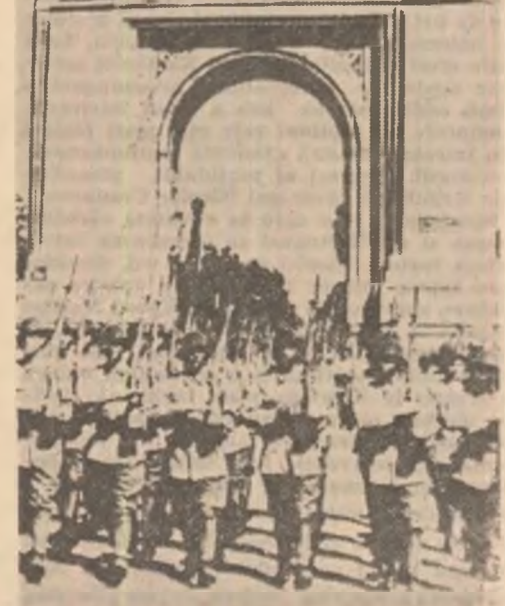
Parada victoriei. Unități ale armatei ro- mane defilind la întorcerea glorioasă de pe frontul antihitlerist. Pod de vase al armatei române construit peste Tisa

„...În coasul cel mai greu al istoriei noastre, am scotocit, în depîlnă întelgere cu poporul meu, că nu există decît o singură cale pentru salvarea țării de la o catastrofă totală. Iesirea