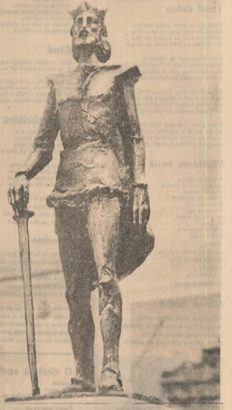
„Mircea cel Mare” — sculptură de Petre Stoicu