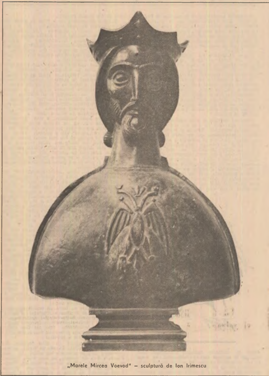
„Marele Mircea Voevod” — sculptură de Ion Irimescu