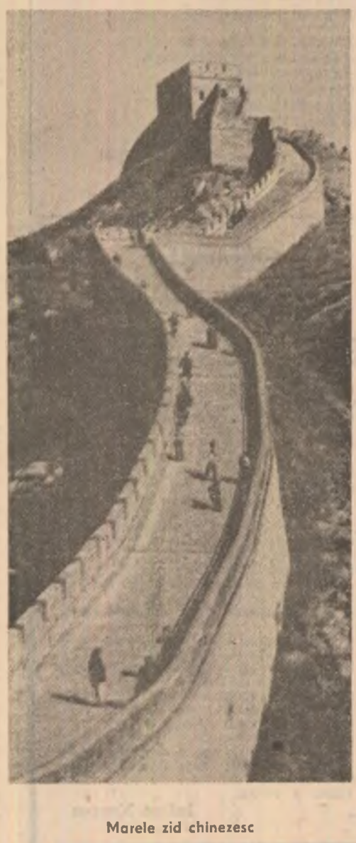
Marele zid chinezesc