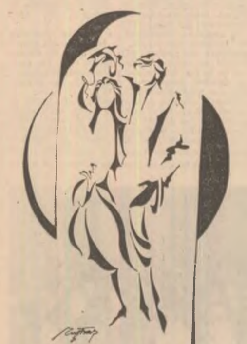
Desene de Eugen Toraș-Oțuz

Viața însă n-î-i doar zîmbete și flori. Si printre stîmperii de mină febrile i se strecoară regretul tuturor celor prezenti de a se fi hotărît scoaterea lui din rolul principal pe motive de