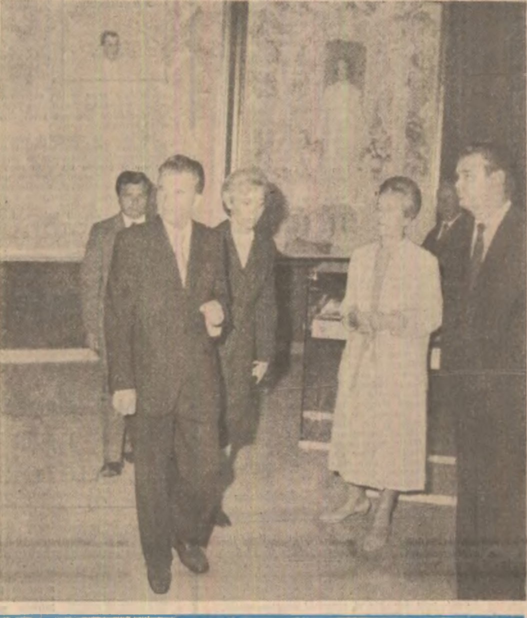
„Cinstim pe toți inaintașii noștri, pe Mircea cel Mare, pe Ștefan cel Mare, pe Mihai Viteazul și pe alții alții. Cinstim poporul nostru, adevăratul fauritor al istoriei! Cinstim revoluționarii, cinstim democrații, pe comuști, pe toți cei care, în diferite etape ale dezvoltării patriei noastre, și-au făcut datoria față de popor, față de patrie și n-au spus niciodată că e greu! Intotdeauna au spus: trebuie să facem totul, să asigurăm poporului prezentul și viitorul liber, să asigurăm națiunii române un loc demn în rîndul națiunilor lumii !” NICOLAE CEAUȘESCU