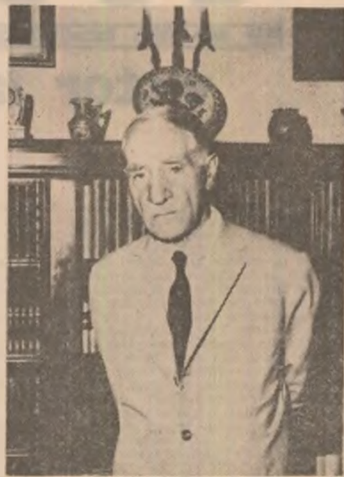
S-a sfîrșit din viață un mare romanist: Iorgu Iordan