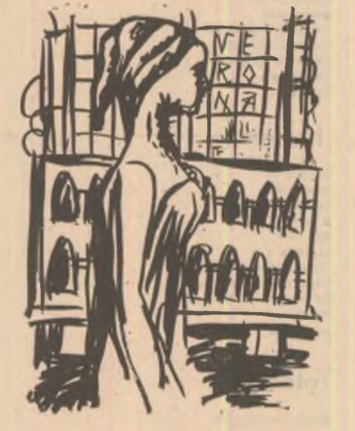
Desen de Sabin Ștefanuț