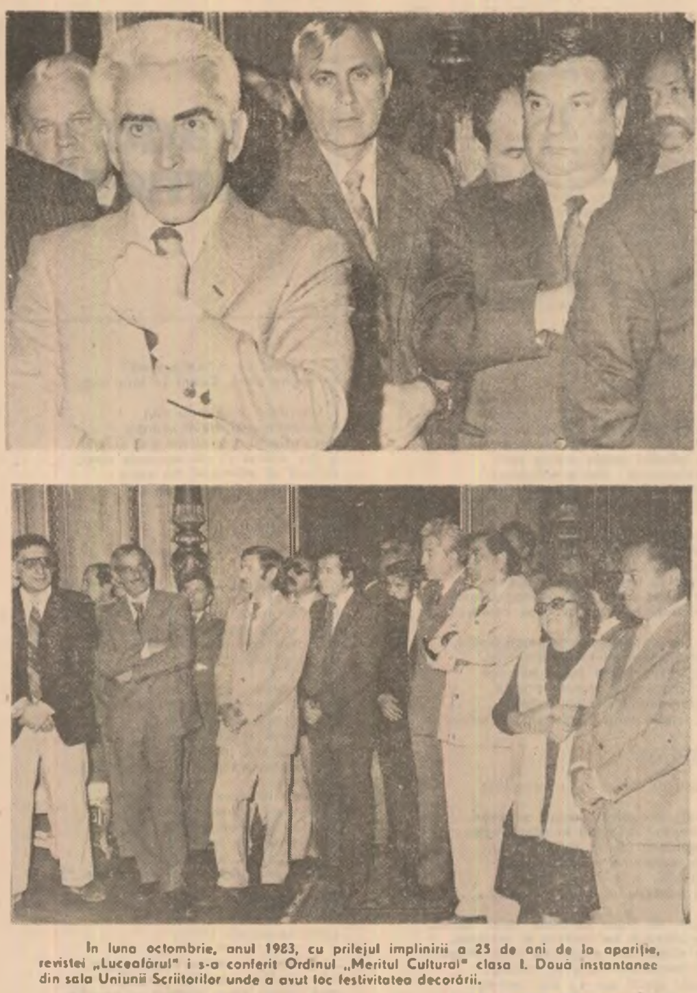
În luna octombrie, anul 1983, cu prilejul împlinirii a 25 de ani de la apariție, revistei „Luceafărul” i s-a conferit Ordinul „Meritul Cultural” clasa I. Două instanțelor din sala Uniunii Scriitorilor unde a avut loc festivitatea decordării.