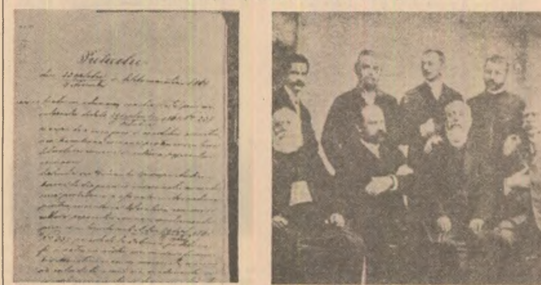
Protocolul adunării generale de Constituție a Asociațiunii