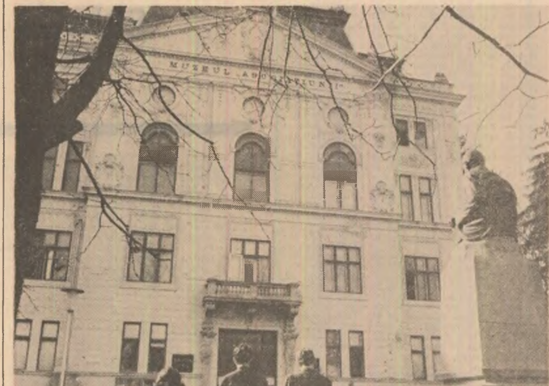
Sibiu, Muzeul Asociațiunii și sediul renumitei Bibliotecii „Astra”

Conceptul redactor și conducător al activității Astrei, expresie a unei continuități remarcabile, a fost postulată și în programele numeroaselor societăți care s-au ilustrat paralel