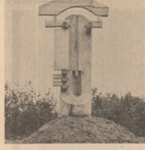
V. Corneștean: „Arc peste timp” În paginile 4, 5 și 6, lucrări executate în cadrul tăberei de sculptură de la Sighetu Marmăției: Fotografii de Mircea Șoncutean

l-a trebuit mult timp pînă să înțeleagă că