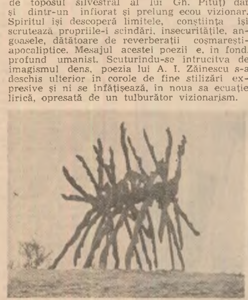
C. Camaroschi: „Plantă carnivoră”

Consecvent convingerii că „sigiliul nouității, al originalității îl fixează asupra creației literare, modalitățile de tratare a ceea ce se înțelege prin subiectul sau motivul ei”, subliniînd, pe tot parcursul cărții, prozovul înregistrat de limba noastră sub multiplele ei ipostaze, folosînd cu autoritate mijloacele și procedeele cercetării specifice, aplicate cu subtilitate și dezvoltîndu-se la textele edificatoare, Nicolae Mihaescu se dovedește a fi, prin Dezvoltarea limbii române, una dintre cele mai competente personalități din domeniul lingvistici și filologiei românești contemporane.