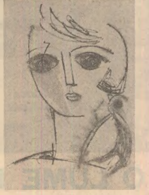
Desen de Raluca Grigorea

Bat orele frumos duminicale pe sub cupola cerului latin. Sînt liniștiți și-i lumină ca-n cristale cînd mari idei migrează spre sublim.