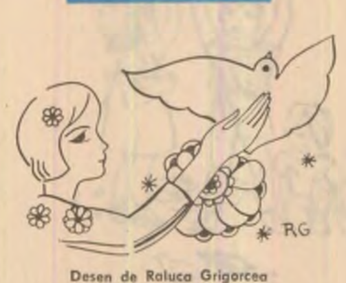
Desen de Raluca Grigoreca