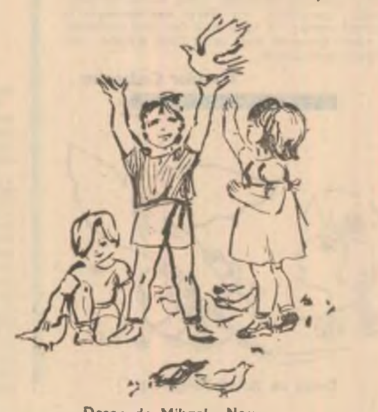
Desen de Mihaela Negru