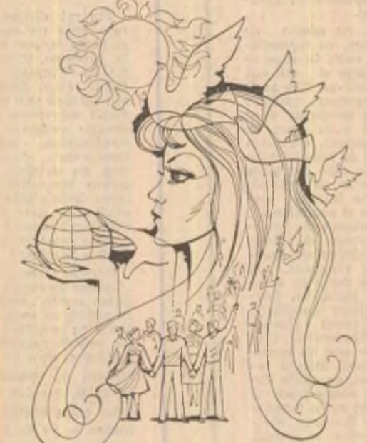
Desen de Ilie Florin

mult, o prioritate a priorităților, intrucît de soluționarea ei depinde însuși viitorul civilizației pe planeta noastră. Aprecînd că perpetuarea cursei înarmărilor, menținerea de trupe și baze militare pe teritoriul străine sînt în flagrantă contradicție cu o politică reală de destindere, cu dezvoltarea unor relații sănătoase între state, bazate pe încredere, țara noastră a consacrat și consacra eforturi intense pentru a se ajunge la inițierea unor măsuri efective de dezarmare, în cadrul unui program cuprinzător, avînd ca