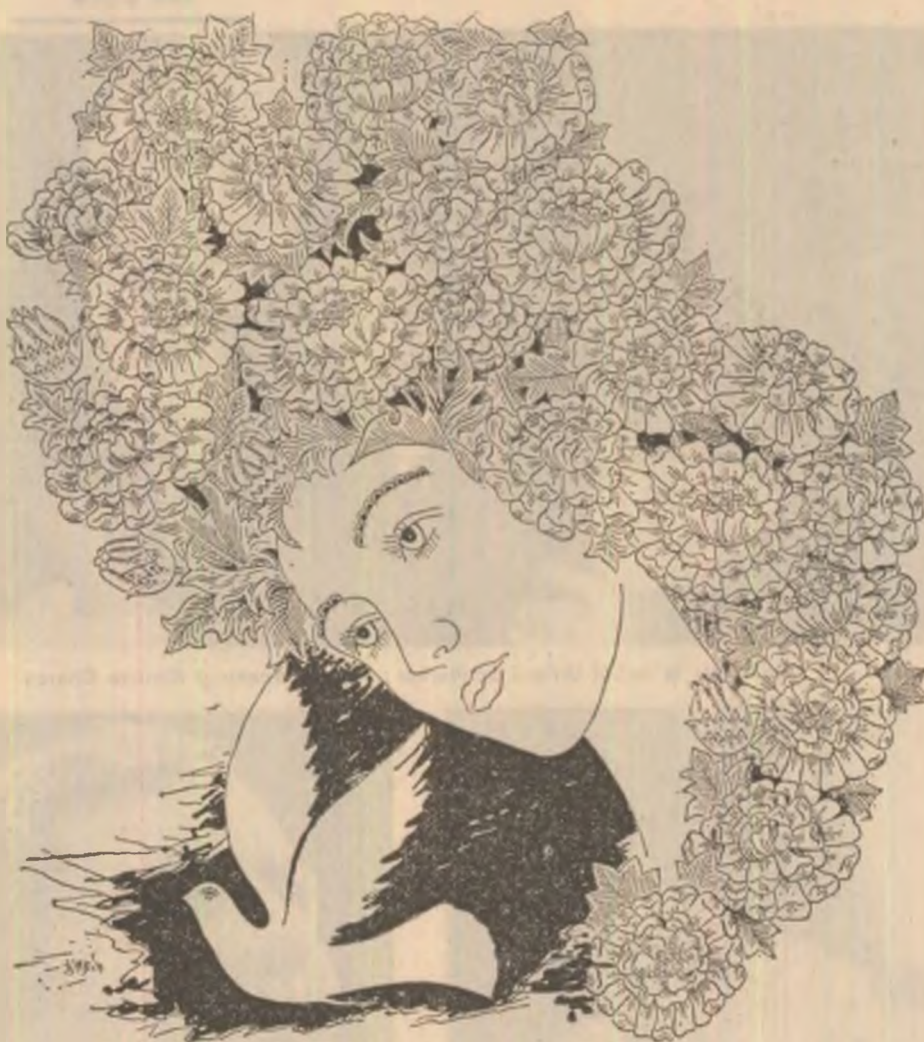
Desen de Sabin Ștefănuț