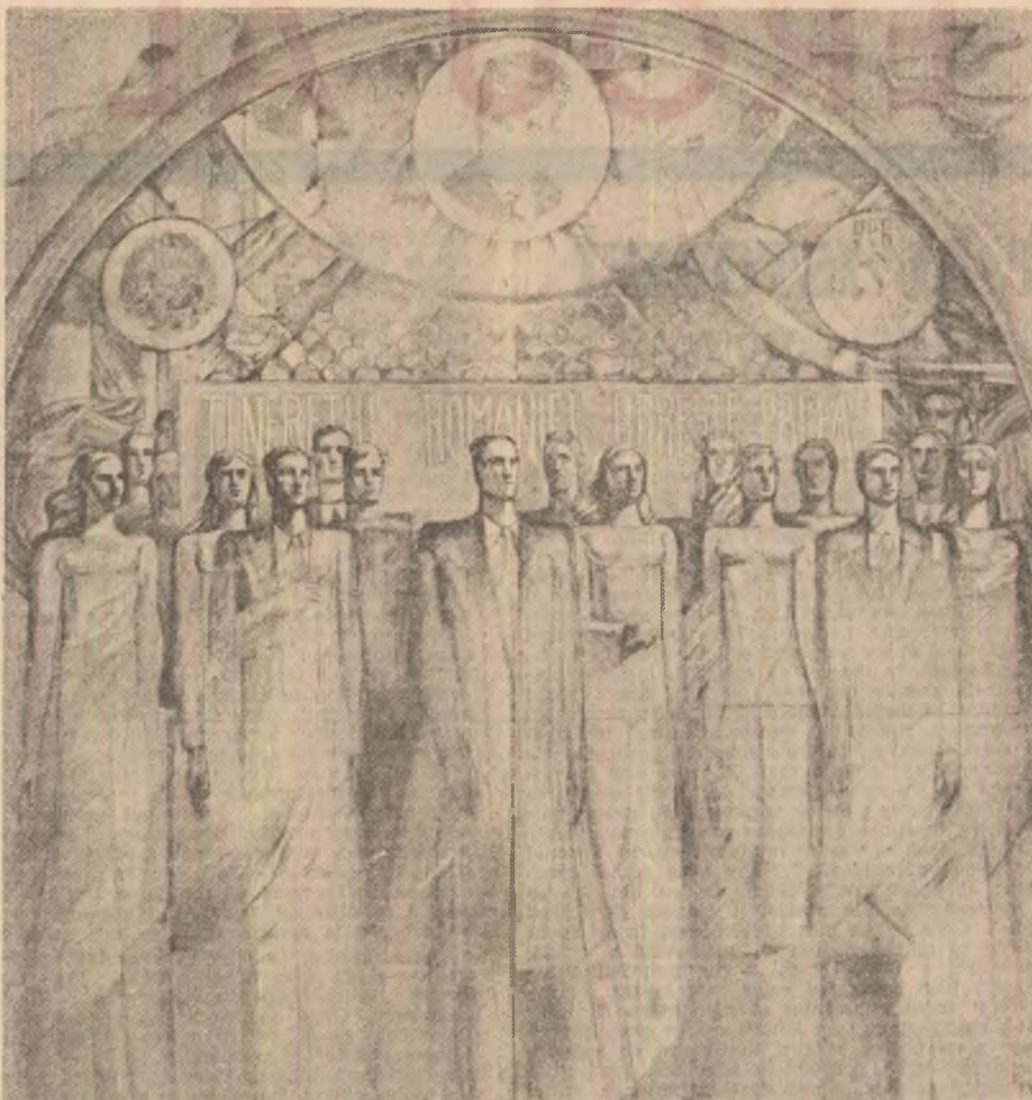
„Tineretul României dorește pacea” — Tabloul de Geta Mermese