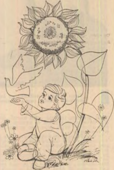
Desen de Ilie Florin

„Intr-o dimineață fiul meu mi-a spus de îndată ce a deschis ochii: „Mamă, tu ești o țară!” Mai întîi n-am înțeles și a trebuit să-mi explic: „Ești așa ca și cum ai fi o țară și eu un ce...”