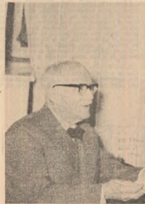
Tudor Arghezi acorindu-i un autograf celui mai tinăr poet al armatăi în 1963, „prezindu-i o stafetă“, cum a interpretat tatăl său, (șaran din Limpezișul Bărgăneșului, gestul argheziian.

tistic, grațian, insolitul artist plastic Benedict Gănescu incit găsiră de cuvînt să-l înscrie chiar pe așful generic ce anunța apariția noii reviste. În speranța că aceste amănunte sînt poate ușor sentimentale dar nerăstine acestei rubrici, în mod deliberat, dar încercăm să definim prin ce se distinge înălțarea stelei lui George Istrate pe firmamentul poeziei contemporane. Fără a ne lansa în integrarea poetului într-un context liric-universalaș cum au făcut-o în mare curent alții comentatori de-al săi, alfel autoritățile ale istoriei și criticii literare contemporane. Să ne ierte distinși, poet și stimați exegeți, dar după părerea noastră George Istrate se revendică din vatra sa natală bărgăneșă, sărăsumar, ca un destin poetic dual, ce oscilează între teluric și mitic (miticul mai ales în varianța sa orfică). Nu alfel crede un mare poet, cu un discernămint atit de rafinat, cum este Ștefan Augustin Doinaș care într-un comentariu de la țit de necesară și clarvăzătoare rubrică „Disciplina inspirăției“ (vezi „Viața românească“, iulie 1985) își intitulăză considerațiile pe marginea evoluției poetului în discuție: „Mit și ritual“ la Gheorghe Istrate. Comentariul respectiv cuprinde și această subliniere pe deplin îndreptățită: „Voi menționa, în fine,