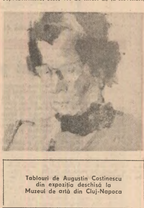
Tablouri de Augustin Costinescu din expoziția deschisă la Muzeul de artă din Cluj-Napoca