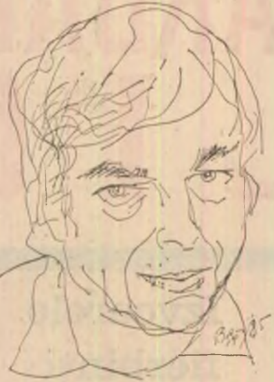
Desen de Teodor Bogoi

Nu arborele, ci umbra lui e adevărată... Nu mama mea, ci eu apar a fi adevărat... In rest eu cred că totul e păcat, Un substantiv c-un verb la nuntă... In timp, către, se mai sărută Cu ceasul Primăriei... Cit despre cai, adio, voi, secunde! O, cite de frumoase-ați fost!