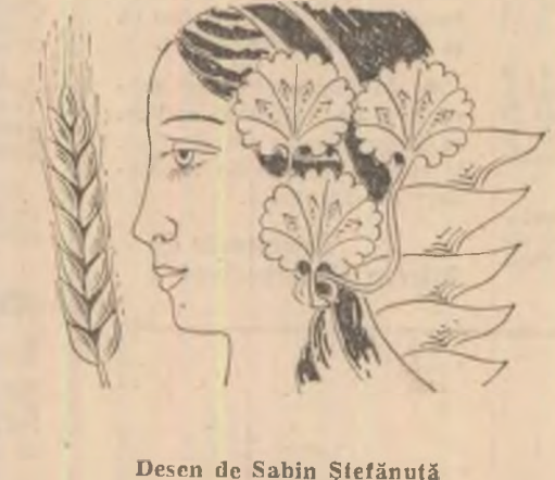
Desen de Sabin Ștefanușă

Prezentare și traducere de Valentin Negoitș (Fragmente din romanul „Surorile Makioka”) * Subiectul unui binecunoscut basm japonez.