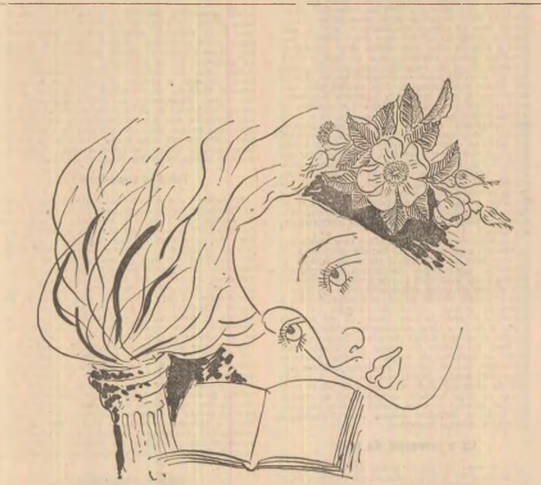
Desen de Sabin Ștefănuță