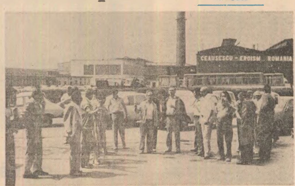
Vizită de documentare a unui grup de scriitori într-o mare întreprindere