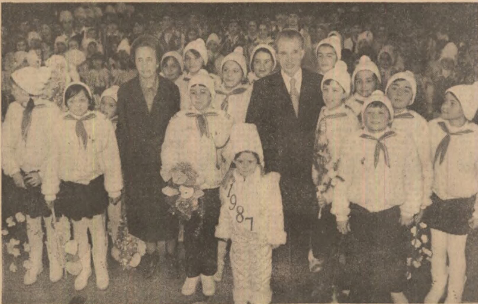
Imagine simbol de la tradiționala manifestare din preajma Anului Nou.