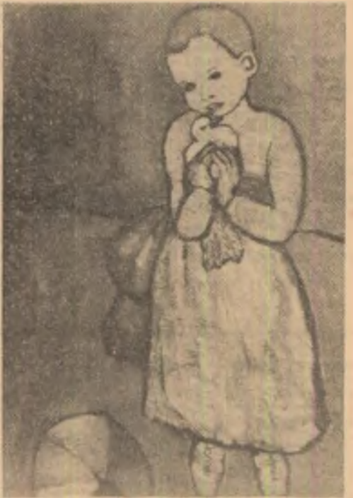
Picasso: „Fetița cu porumbel”

DINTR-UN RECENT INTERVIU al lui Rene Haeseryn, secretar general al Federației Internaționale a Traducătorilor: „Federația noastră are ca scop realizarea unei mari bune înțelegeri între popoare...”