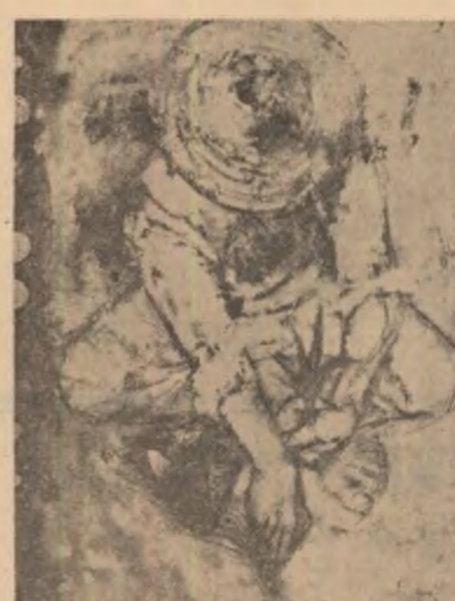
V. Orlando (Cuba): „Semănător”

Pentru somnul tău, foaia liniștea lumii Pentru somnul tău, sîrutul cast al acruului Pentru somnul tău, inima trandafirului Pentru somnul tău, un drum care să te ducă (pentru somnul tău) spre zori călduți (pentru somnul tău) fără să trec prin noaptea Pentru somnul tău.