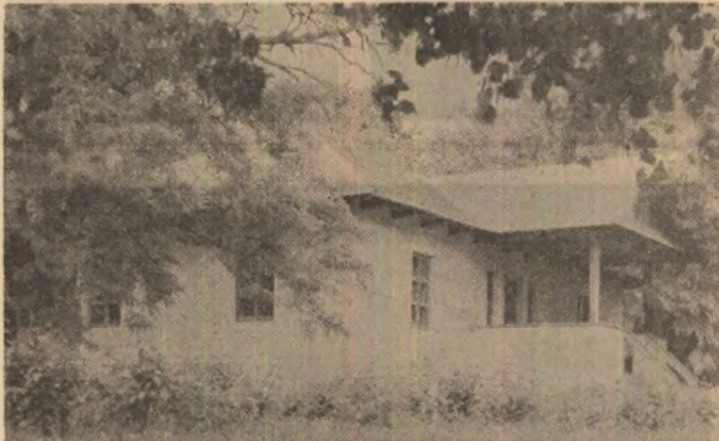
Muzeul memorial M. Eminescu - Ipotești