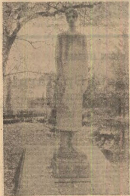
Monumentul Ștefan Luchian