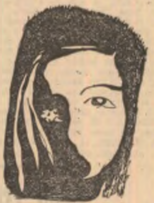
Desen de Constantin Dracșin