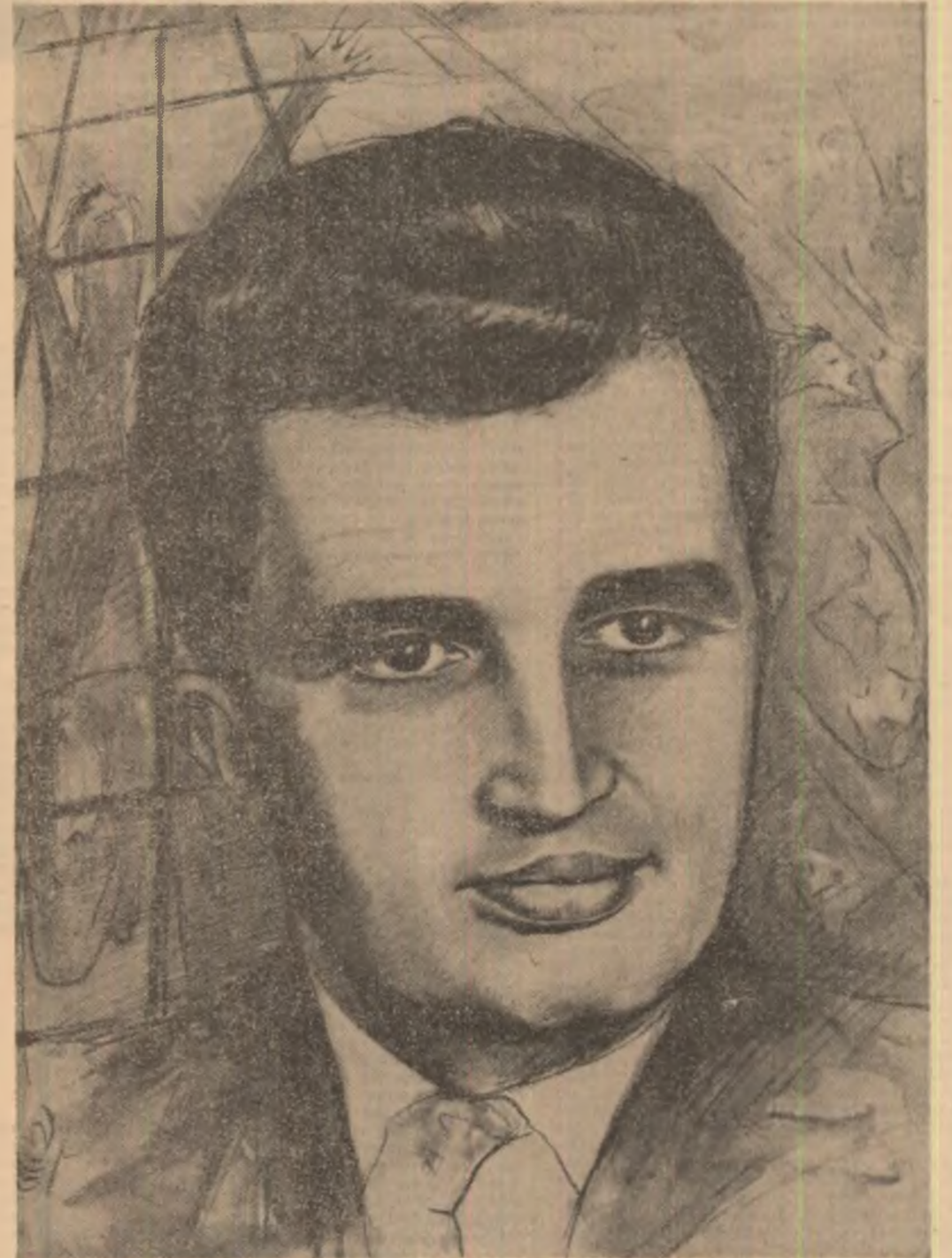
Tablou de Al. Torella - Italia