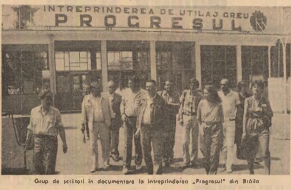
Grup de scriitori în documentare la întreprinderea „Progresul” din Brăila