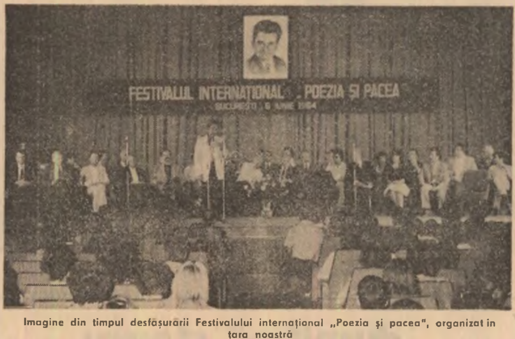
Imagine din timpul desfășurării Festivalului internațional „Poezia și pacea”, organizat în țara noastră