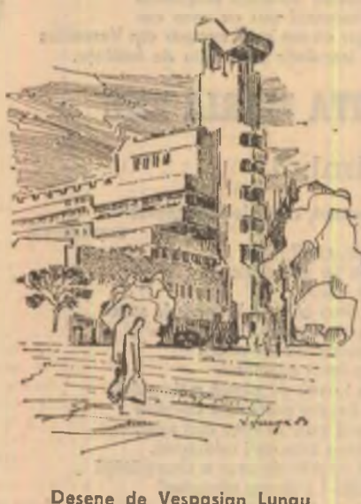
Desene de Vesposian Lungu