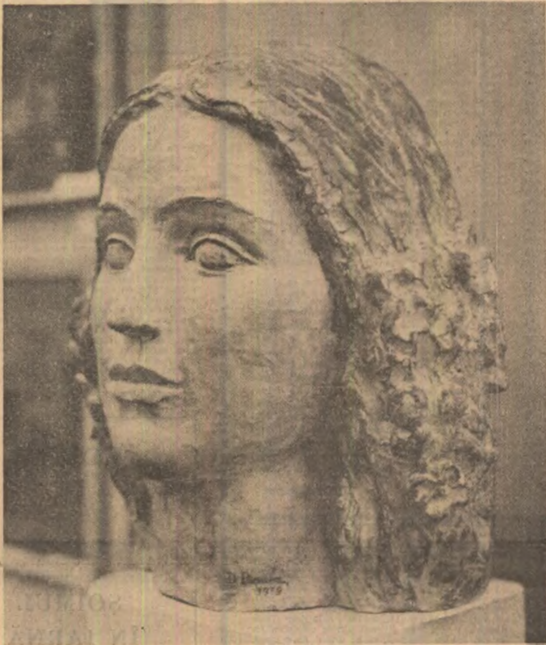
„Tinerete” — sculptură de Dumitru Picevoa