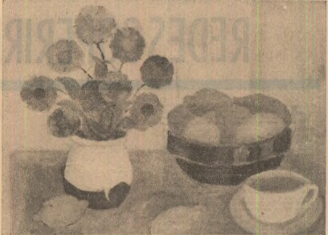
Tablouri de Octavia Berca din Expoziția deschisă la biblioteca „Mihail Sadoveanu”

mergînd spre miază-zi cu fața spre cîmpie unde pogoră și lumina nu întru slavă ci tîmăduire