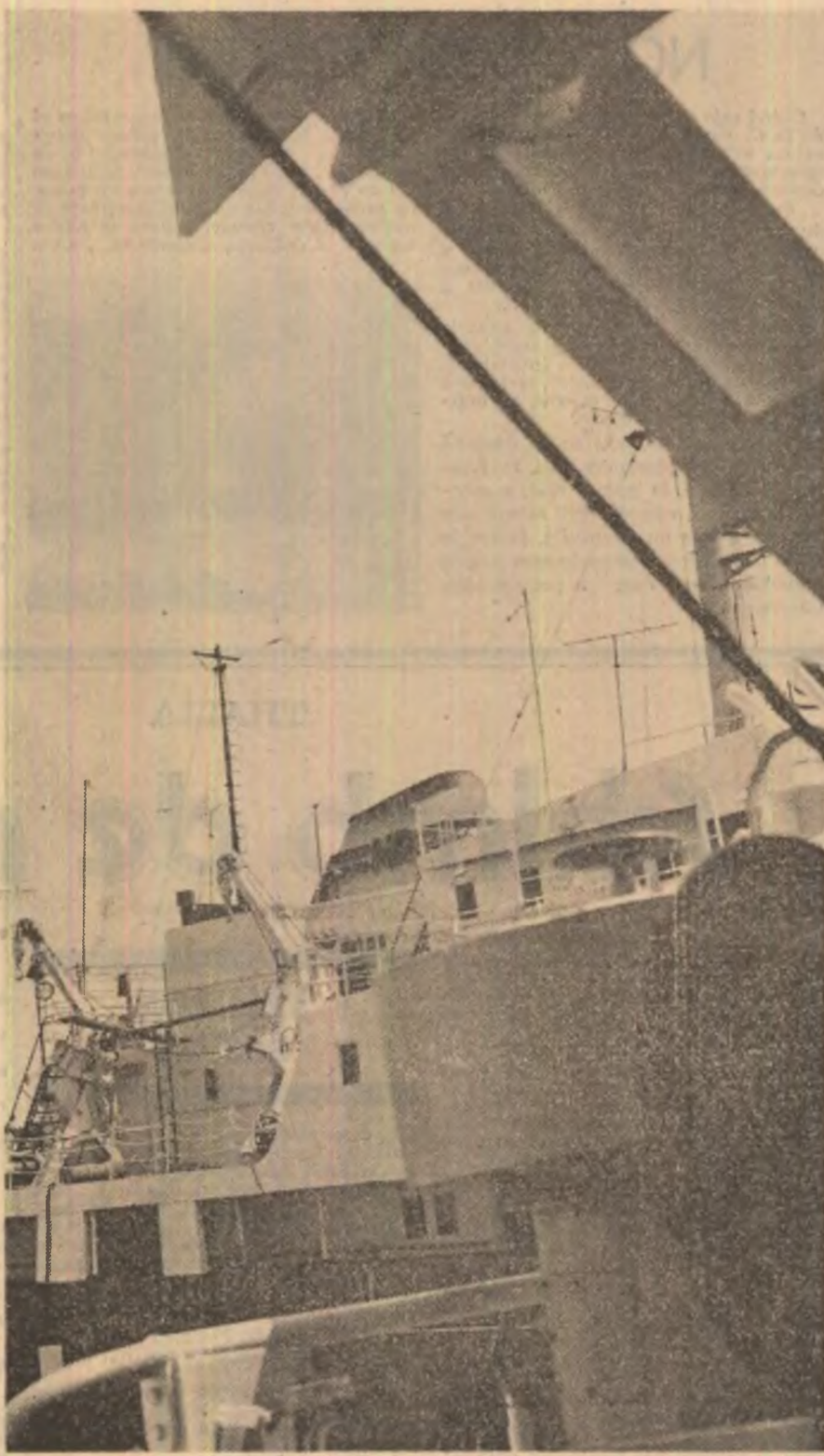
Șantierul naval Brăila