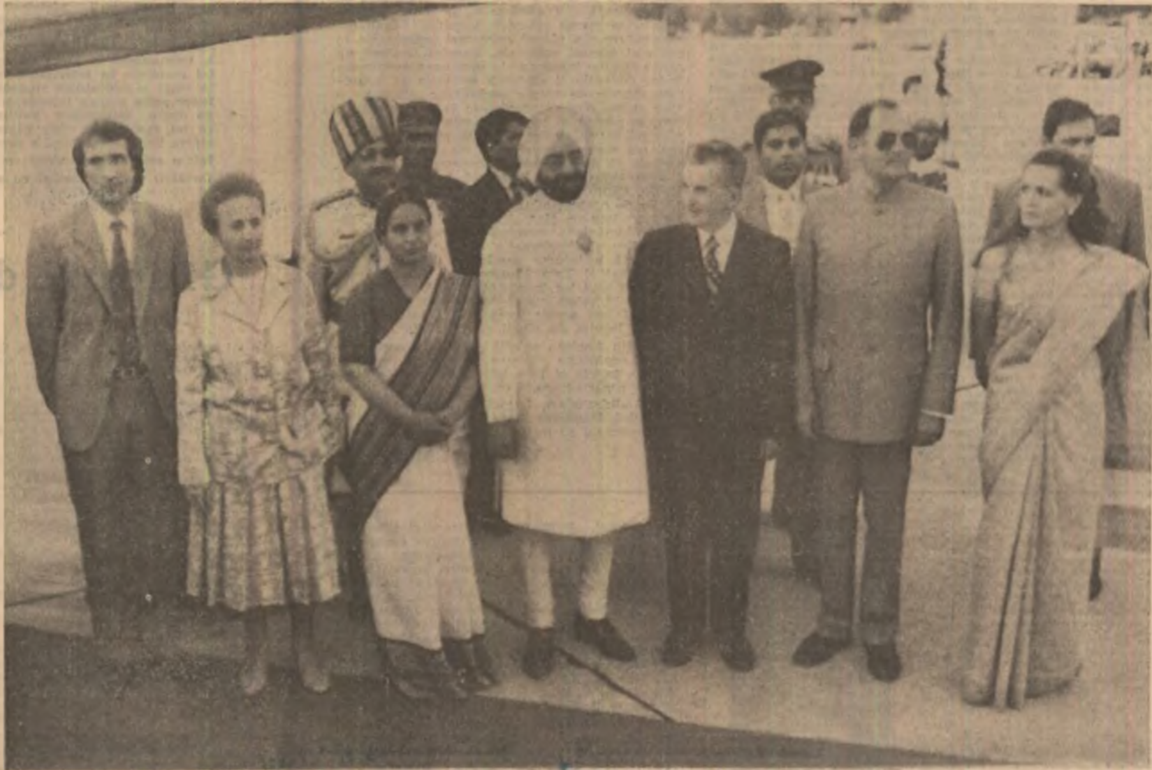
Imagine de la sosirea în India a înalților oaspeți români