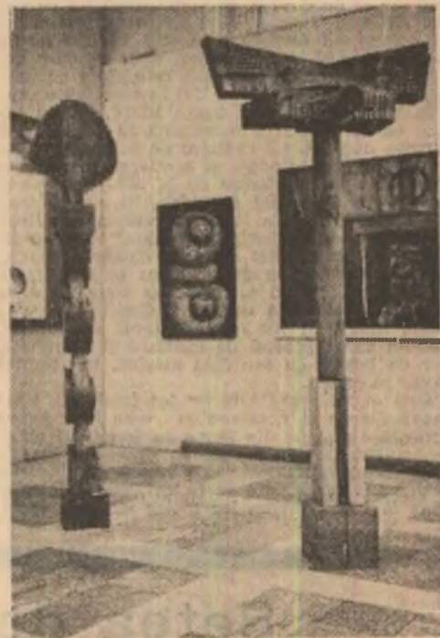
Gh. Ilescu Călinești : „Semne pentru pace”

Trăim piesa vieții după o măsură proprie. Trăim ciudată piesă jucînd roluri mari sau mici. Unii