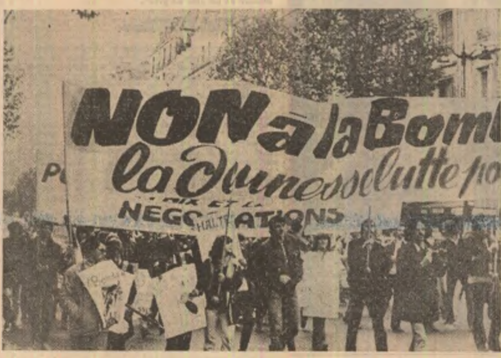
Amplă manifestație pentru pace la Paris

ROMANUL „EVADAREA” al cunoscutului scriitor vest-german Gisele Elzner revizitează „Domnul Bovary” a lui Flaubert, pe care autorul o plasează în ultimul deceniu al secolului al XX-lea. Lila Besslein, eroina romanului, trăiește într-o bunăstare relativă fără să cunoască însă bucuria dragostei alături de un bărbat indiferent. Caută să evadeze din această situație cenzurînd încercînd să mănucască, să consume dro-