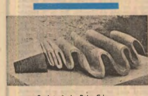
Sculptură de Bela Crisan

„Limba poeziei contemporane se apropie de vorbirea populară. Nu demult am participat la Dîjandari, în Fundaia, la un program tv dedicat poeziei. Acum s-a afirmat cu tărie faptul că poezia hindî contemporană exprimă mai convingător și mai multilateral decît oricînd pînă acum în istoria ei toate sentimentele omului și o face într-un mod măiestru. De la începutul secolului, cînd s-a născut poezia în limba hindî, trecînd peste perioada influențelor străine deosebit de puternice, poezia indiană a progresat continuu, enorm. Noi, poezii, am făcut mult, dar sîntem convinși că nu totul...”