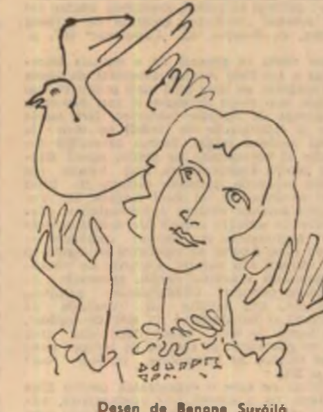
Desen de Benone Șuvăilă

Mine de aur te-am văzut cum sapti, negrule fără pămint.