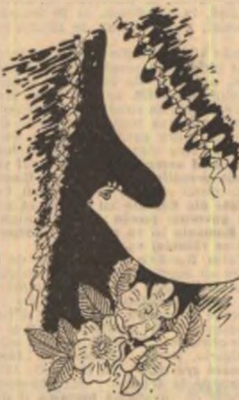
Desen de Sabin Ștefănuță

Știi și dreptății, singurul lucru care ne poate salva de barbarie: cultivarea păcii.