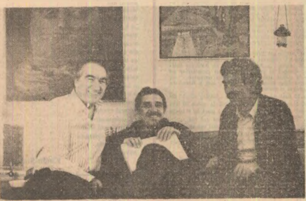
În Mexic, cu Gabriel Garcia Marquez și Alvaro Mutis