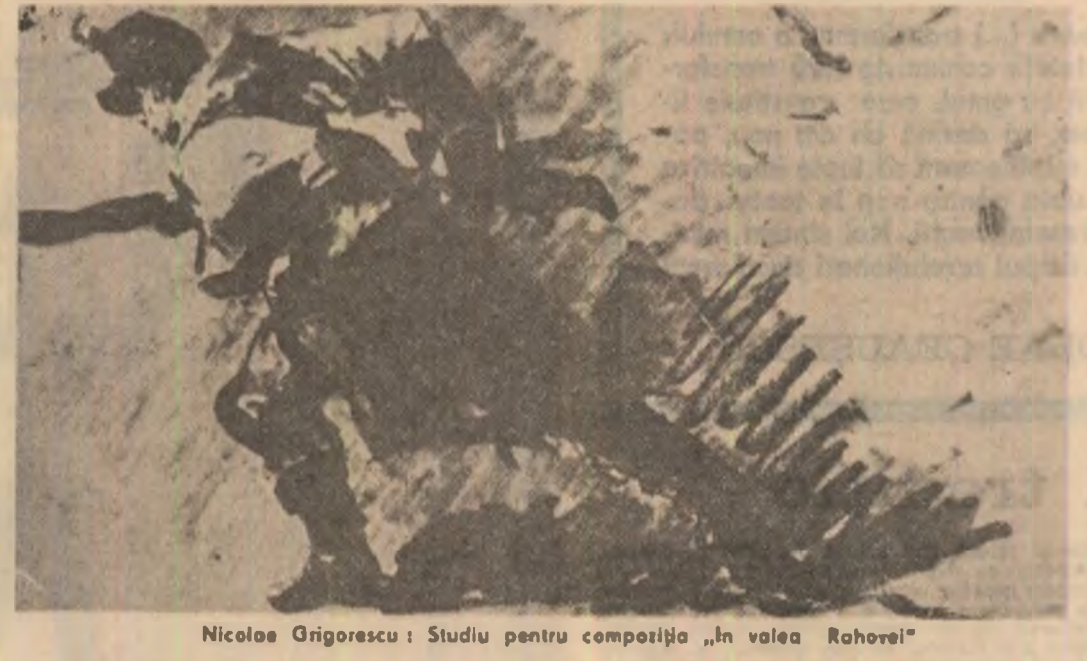
Nicolae Grigorescu: Studiu pentru compoziția „In valea Rahovei”

9 MAI d intre cei ce au însoțit oștile române la Plevna, acum o sută zece ani, a fost și pictorul nostru, clasicul Nicolae Grigorescu. Desenele sale, unele devenite pinze, ne vorbesc în graiul artei, cel al amănunțului atîngător de suflet, despre greul jertfei prin mișcarea carului tras de boi încercat cu rîntîi, cufundat în noroaiile Balcanilor, smuls pînă la urmă printr-un efort urias al bouilor frate cu omul. Aici, în celestarea dramatică, Grigorescu va descoperi sufletul țărânului român, iar alături de el această vîrtă credincioasă a lui ce va fi obiectul cîtorva capodopere, cele mai reprezentative ale genului său.