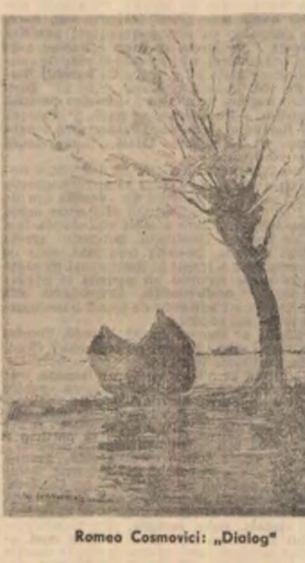
Romeo Cosmovici: „Dialog”

Ca să citim mesajul ei suprem Care ne arde ochiul și-l inghîmpă, Ar trebui în punmul strîns s-avem Povestioarea Flamură Olimpă!