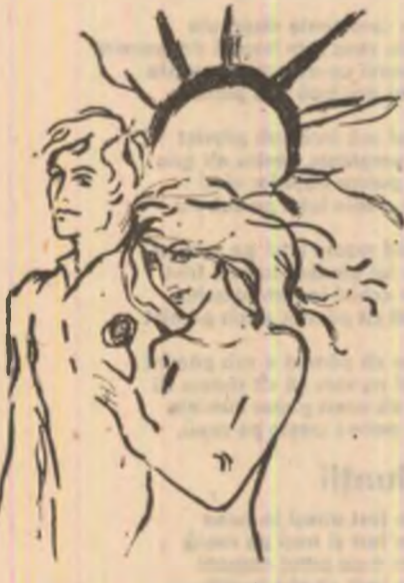
Desen de Mihoela Negru

Căuta punctul slab Zidit în fragmentul acela de spațiu Cu privirea pierdută-n NICIUNDE Și e simții fugari În proprio SA carne Rămînd mult timp În acea redută a tăcerii.