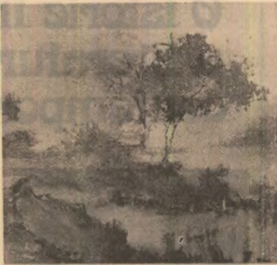
Tablouri de Mircea Ionel

(Fragment din romanul „Herghelia verde”)