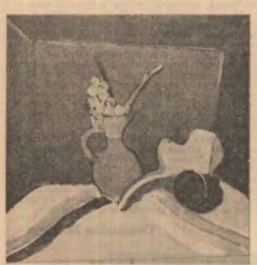
Tablouri de Ion Păca

— Sofia, exclamă uimit Andrei, tu aici ? — Femeia, brunetă, cu ochii verzi, mari și umezi, nu-l recunoscu, tresări puțin intrigată. Apoi brusc se dezmetici. — Andrei ! — Dar văd că sînteți cunoștințe vechi, se miră doctorul Mușat. — Foarte, îl lămurî Andrei. Am fost colegi de normală. — Acum toată lumea, care poate, e la război, completă Soare. — Te-ai recășătorit, Andrei ? îl privi Sofia cu glasul pierit. — Nu, răspunde Andrei, o să mă-nsoz după sfîrșitul războiului cu principesa Absinției. — Un hotot de ris, o avalanșă de cuvinte. Își luară bun rămas și plecă ră fiecare cu ale lui.