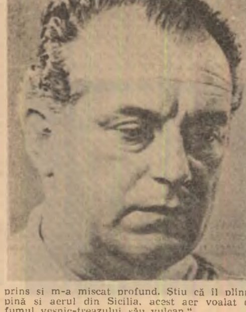
prins si m-a miscat profund. Stiu ca îl plina pe aerul din Sicilia, acest aer voalat de fumul vesnic-trezului său vulcan.”