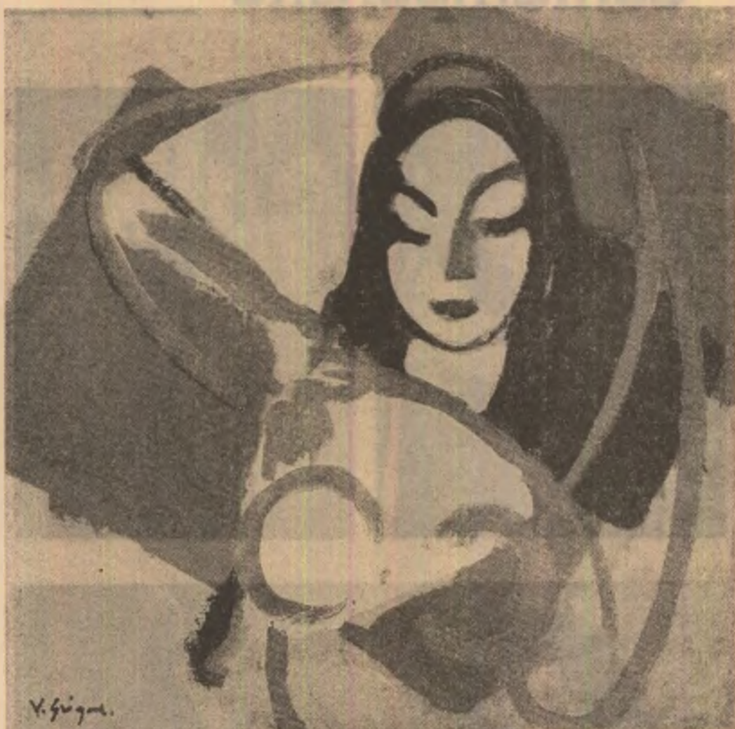
Tablouri de Vasile Grigore

— Sinucigașii își au și ei acuzele lor, am zîmbit. — Scuze, mă înghină ea cu dispreț. Ce scuze