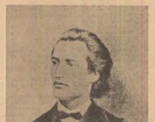
Narcis și Hyperion, ființa situată „între imediat și absolut, cu nostalgia oglinzii dintii”.