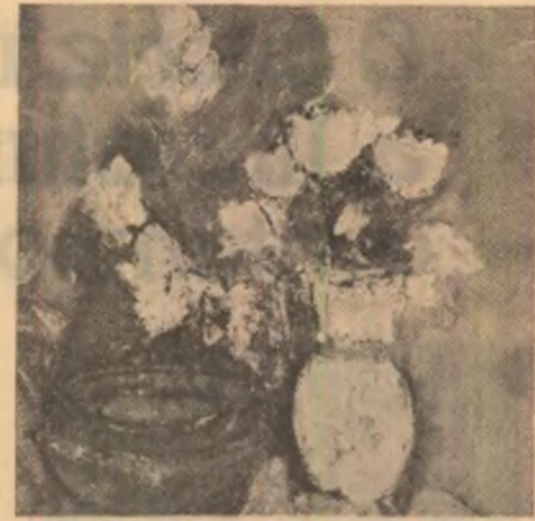
Iacob Lazăr: „Flori”