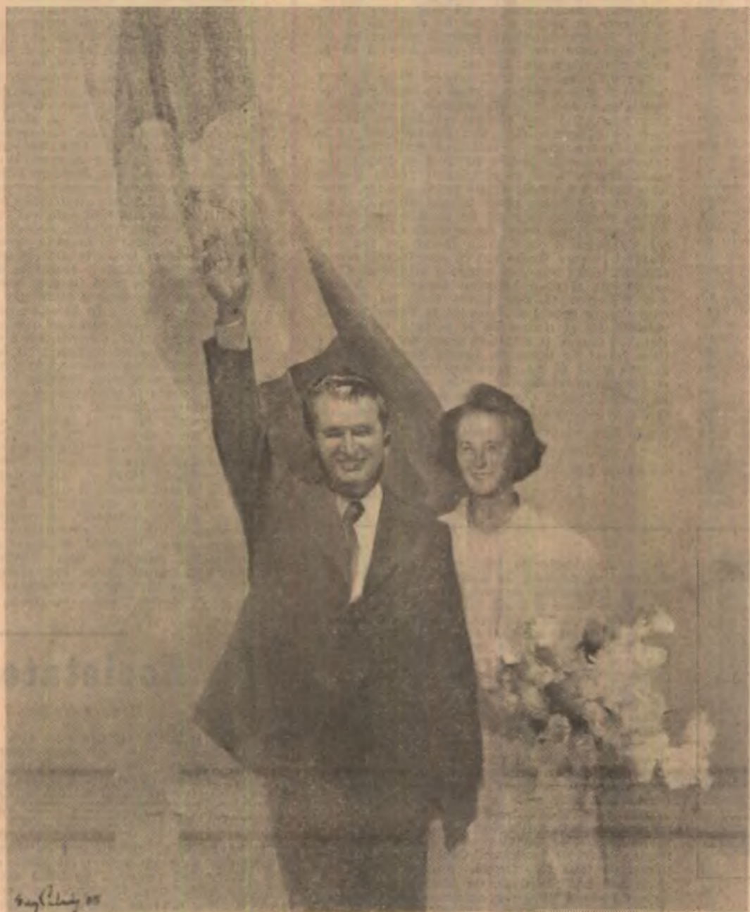
OMAGIU de Eugen Paolade

V astă, eroică și grandioasă în toate reprezentările ei materiale și spirituale, în tot ceea ce exprimă azi noua geografie economică, moral-politică și socială a patriei, această cititorie a unității de voință și acțiune, gândirii înalte, cutezătoare și a faptei de muncă și viață pe măsură este în fond și idealul existenței plene, este idealul conștiinței creatoare. Spectacolul omagial dedicat Zilei naționale ilustrează cu pregnanță aceasta și, într-un anumit fel, situat sub paleta largă de semnificații și reflexii pe care le-a prilejuit recentul Congres al Uniunii Zilei naționale ilustrează cu pregnanță aceasta și, într-un anumit fel, situat sub paleta largă de semnificații și reflexii pe care le-a prilejuit recentul Congres al Uniunii