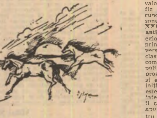
Desen de Mihaela Negru