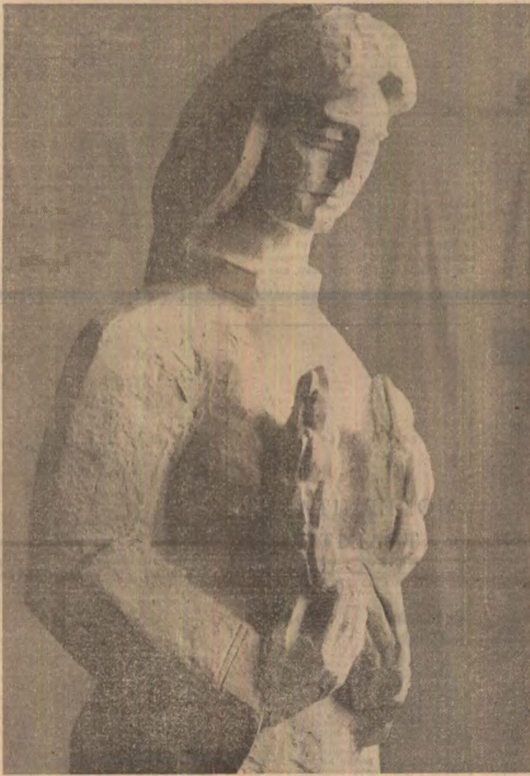
Sculptură de Ion Vlasiu