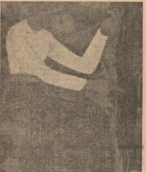
Picturi de Gao Shiguang