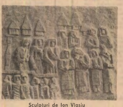
Sculpturi de Ion Vlasiu