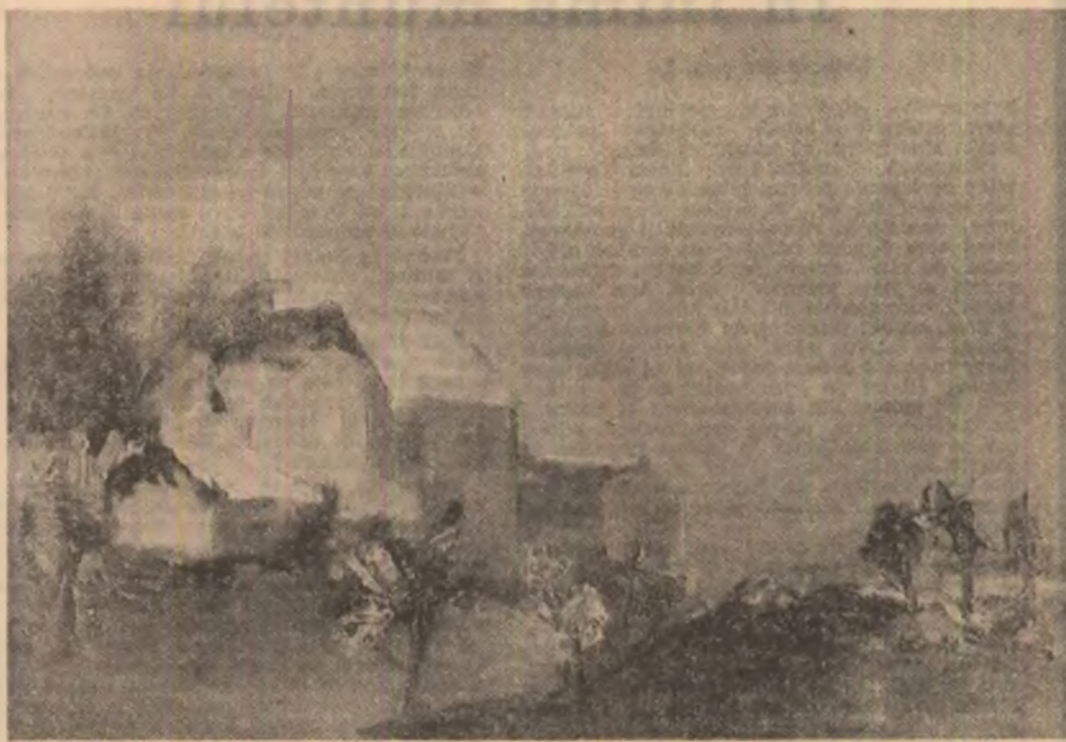
Tablouri de Luminița Tudor