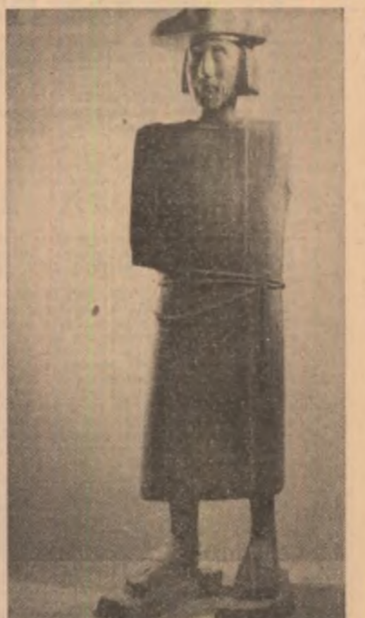
Sculpturi de Ion Iancu