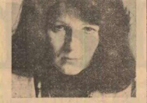
figura de loc comun, reprizarea lirismului comu, apelul la proximitate...