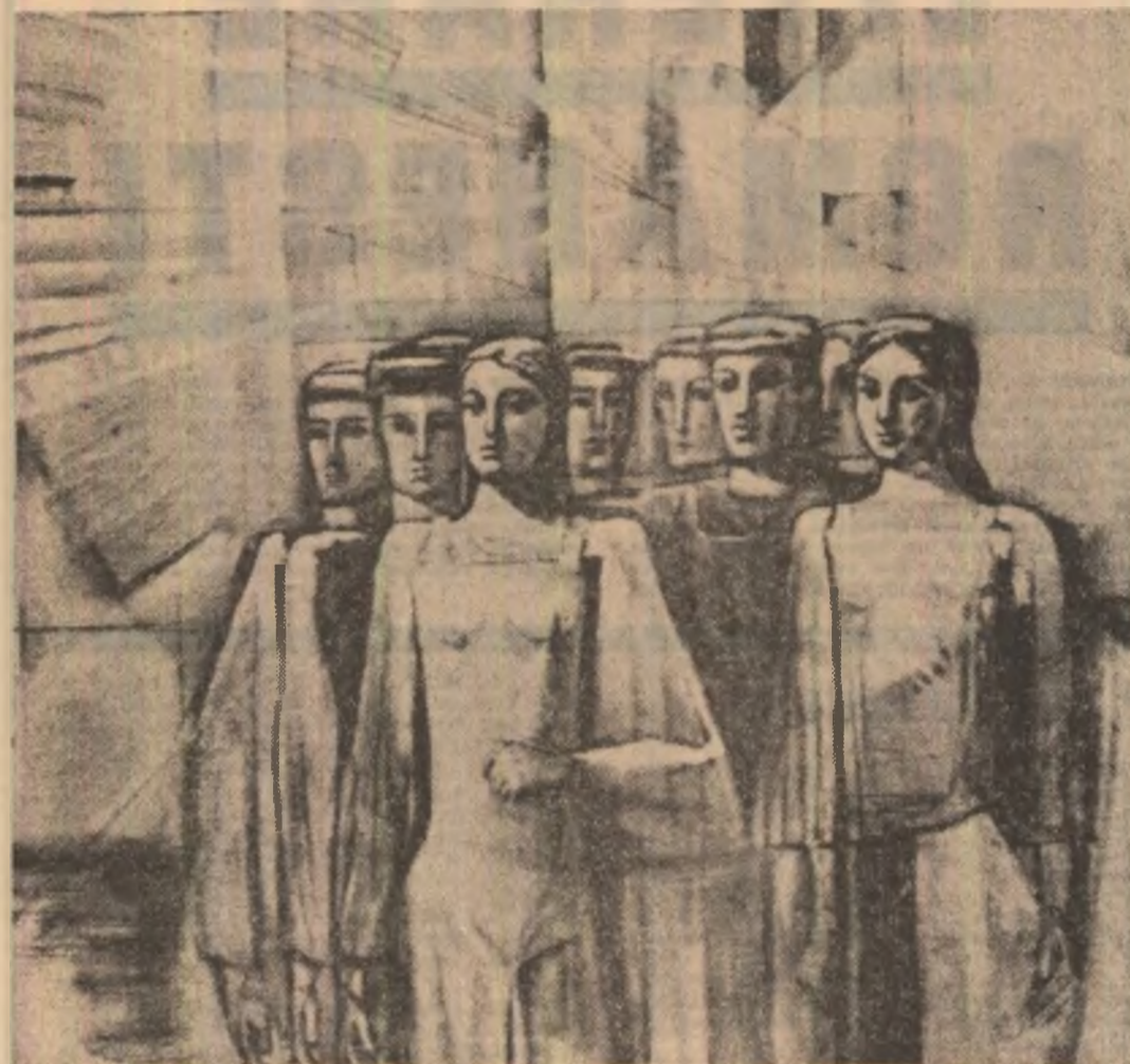
Geta Mermese: „Constructorii”