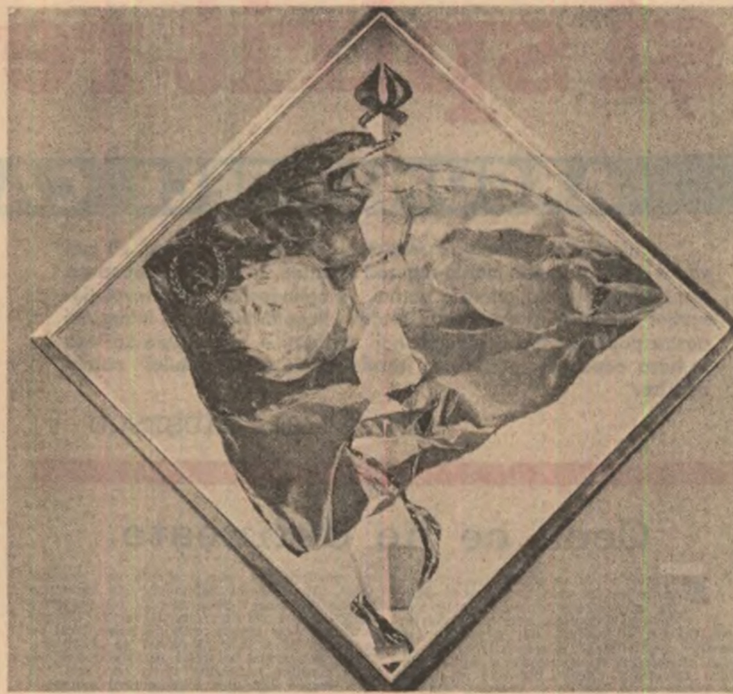
Elena Greulesi : „Omașii”