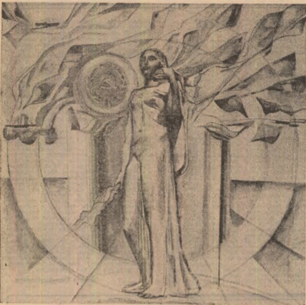
Geta Merzeze: „Omagiu”