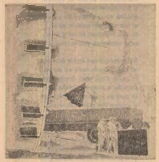
Ion Bișan: „Utilaj Greu”