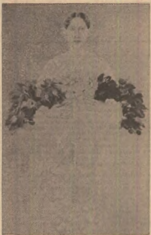
Elena Greculesi: „Omagiu”

Meleg de aur! Soarele nu are în tine-amurg și-n brazde, cînd îl culci, în lanuri floarea soarelui răsare iar strugurii pe-araci se fac mai dulci.