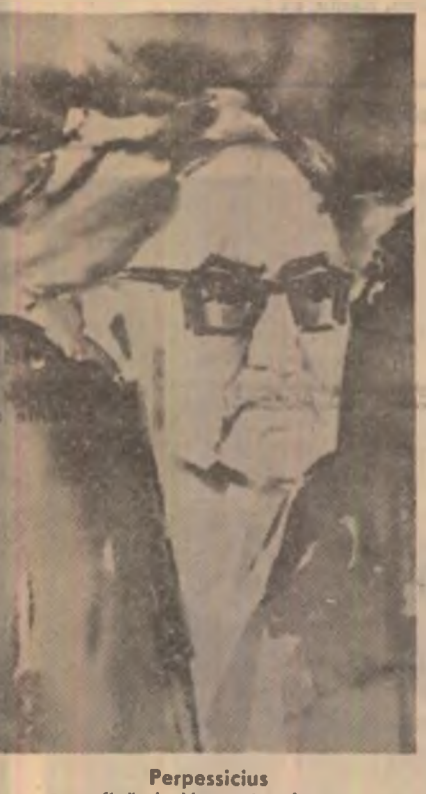
Perpessicuis grafică de Vespasian Lungu

sine resemnată, peste care sună timbrul dezamăgii al confesiunilor postbelice ale lui Remarque, d-l B. Jordan realizează în același timp un documentar și o evocare din cele mai emoționante ale acestui subterbul pedagogic, care este școala normală.“ („Cuvintul“, 18 Ianuarie 1933; „Mențiuni critice“, 5, 1946) Opere, 6, 1973).