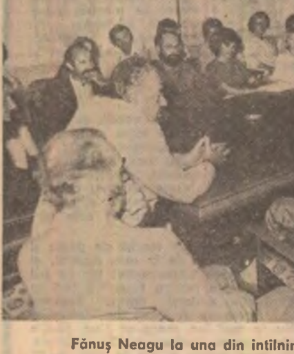
Fănuș Neagu la una din întîlnirile cu pasionații de literatură din Brăila

În fraze exemplare, de o frumusețe și o claritate care le dau dreptul să stea alături de afirmațiile despre limba română făcute de marii clasici, Fănuș Neagu dă un elogiu limbii la inobolabilele cărăia participă prin scrisul său: „A vorbi frumos românește, sau cel puțin corect și logic, ține în chipul cel mai firesc de iubirea de țară. Măsură neamului nostru nu poate fi decît limba pe care o vorbim.“