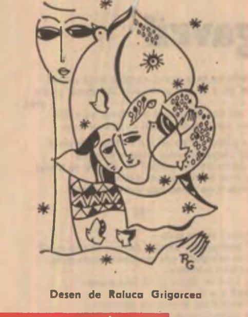
Desen de Raluca Grigoreș