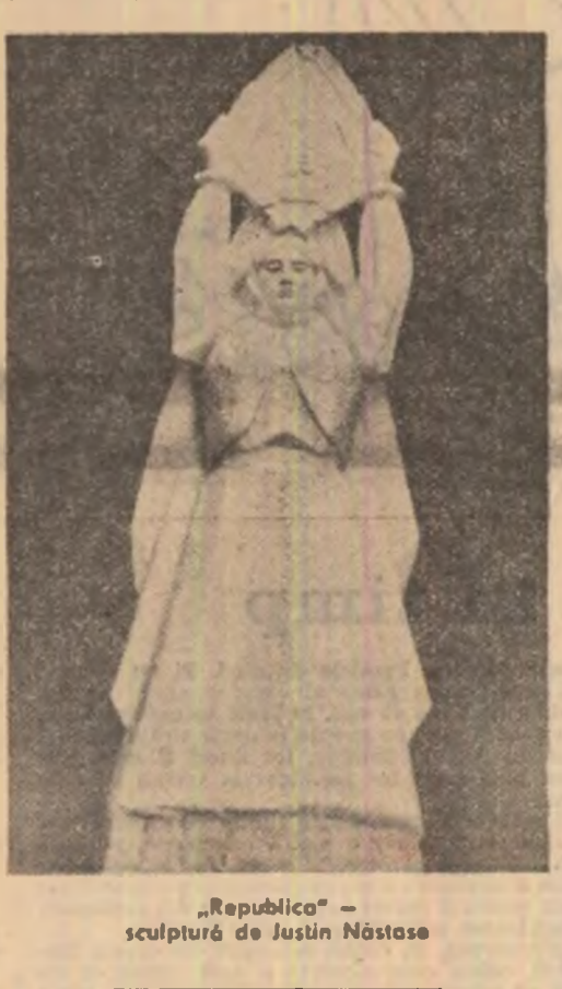
„Republica” — sculptură de Justin Năstase