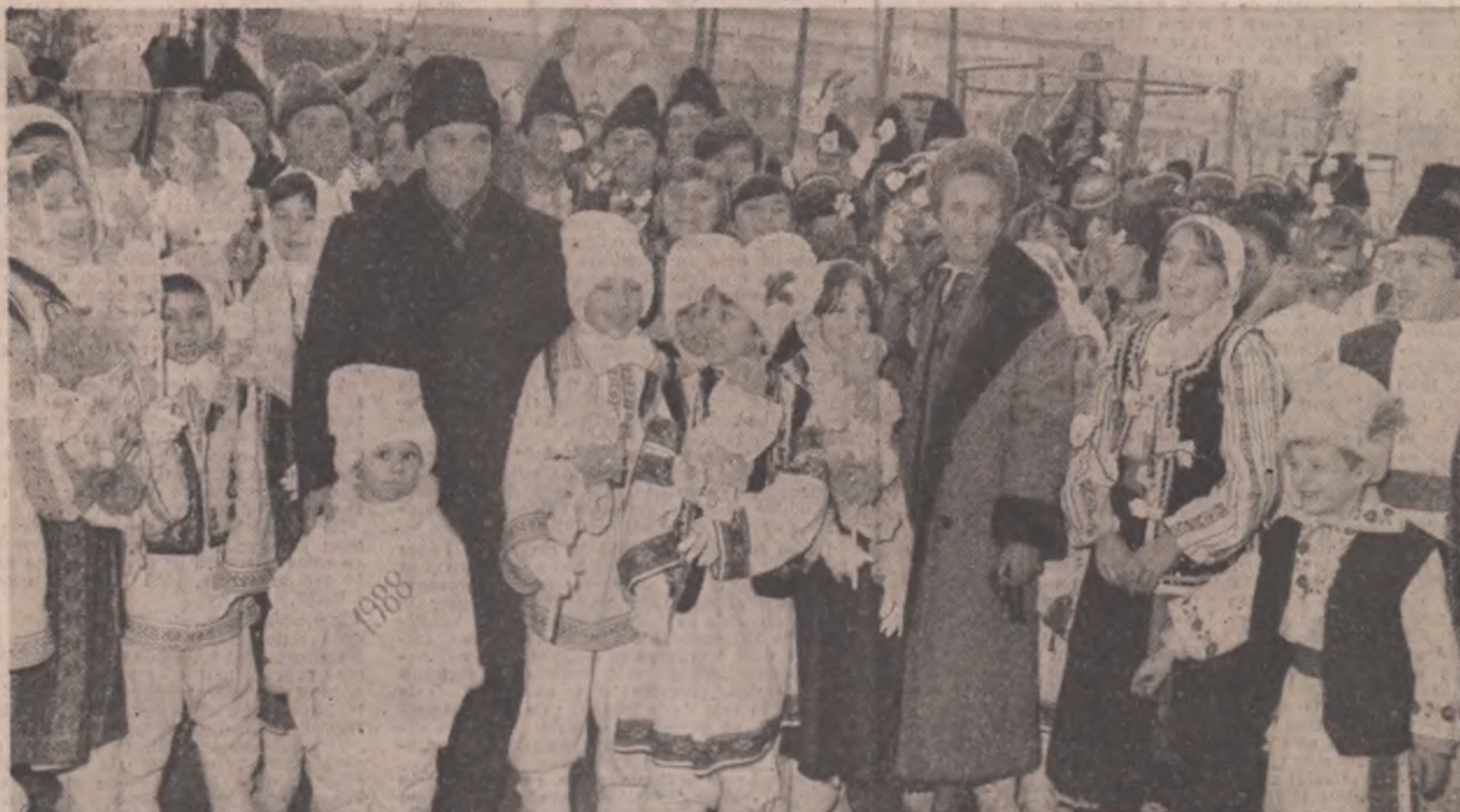
O imagine-simbol din timpul tradiționalei sărbători a Plugusorului