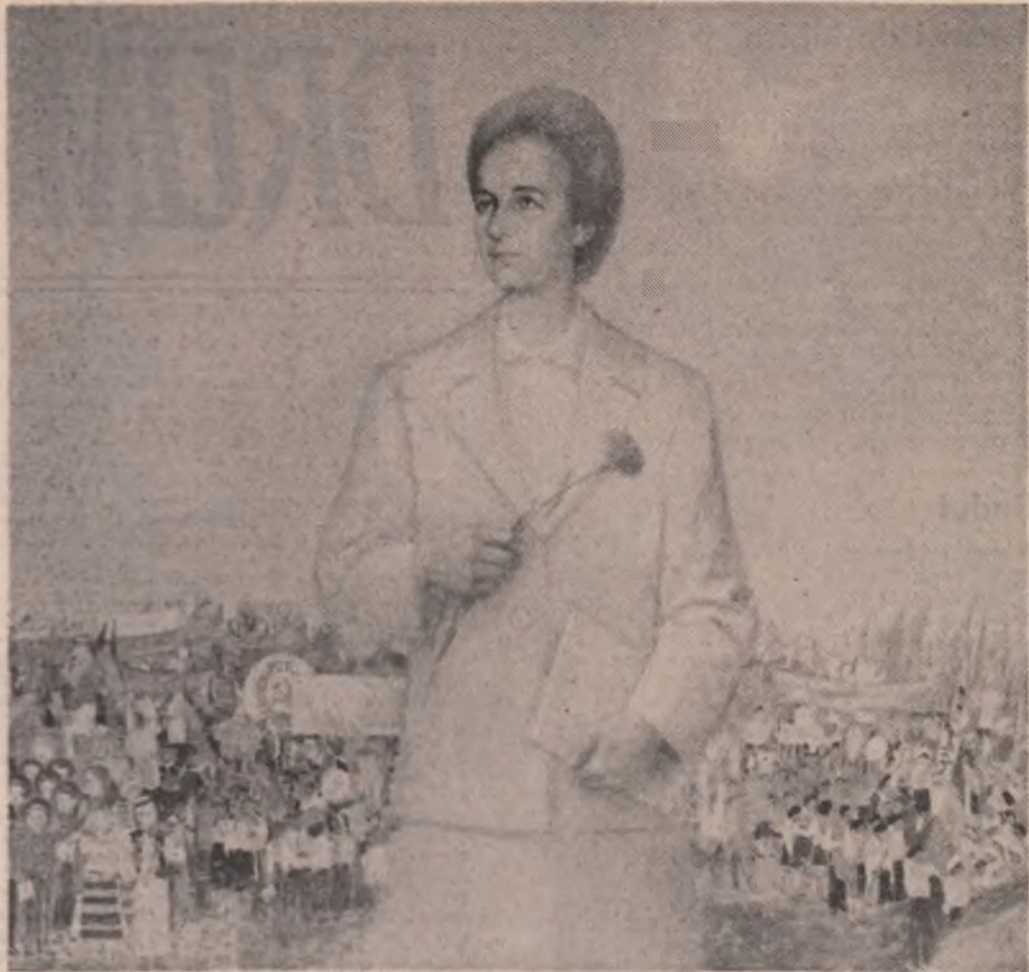
ZI DE SĂRBĂTOARE — tablou de Vasile Pop Negreșteanu

asemenea climat de melancolie cunoaștere, de perfecționare a gândirii, a vocației profesionale, legarea tot mai strânsă a învățămîntului cu producția, așezarea muncii pe criterii științifice și după orientări vaste ale progresului, ale noului în toate domeniile și sectoarele de activitate, reprezintă în epoca actuală și o programatică și indiscutabilă condiție a personalității creatoare, a eticii muncii și vieții în folosul poporului, al patriei. Gânduri de stimă și recunoștință se îndreaptă de aceea, de ziua aniversară, către tovarășa Elena Ceaușescu, exemplu înalt de