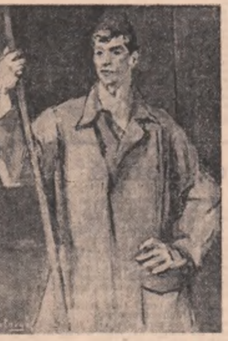
H.H. Cotargi: „Oțelul”