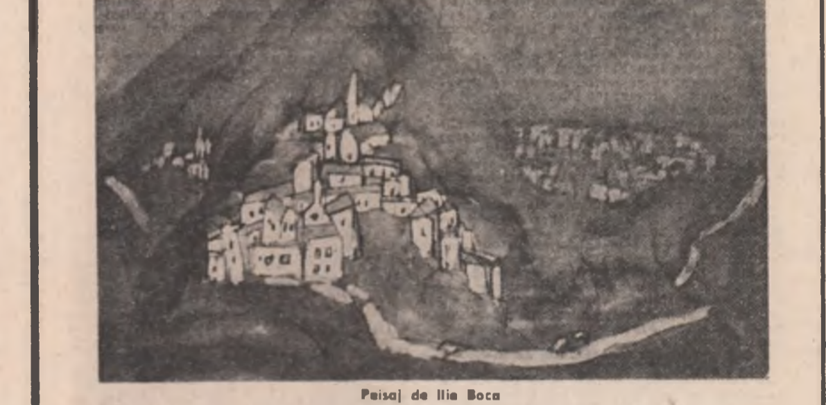
Peisaj de Ilia Boca

Îmi pare rău că am trecut de atunci 30 (treizeci) de ani. Pun o întrebare prostască : anii chiar trec așa, cum li taie capul ? Eram zănașec (nauc), gata să mă îndrăgostesc și de arborii de soție (m-am înșurat la vreme și de vreme) și de drumuri cu sănii și, mai ales, de plecarea la drum. Unde ? Iaca, nu știu nici azi. Știu că fusesem dat afară de la ziarul tineretului, și de la plus cîteva reviste adiacente, și de la radio și de la televiziune în formare. Am plecat la țară (comuna Gradiștea, raionul Făurei, regiu- nea Galați, — azi județul Brăila). Ai mei tăie- seră porcul, erau sănătoși, aveau trei butoaie de vin roșu, buturugă, și eu o idee de parveni- re. „Voi scrie o năvălă și-i voi da gata” (Fuse- sem exclusiv din facultatea de Filologie, dim- preună cu Grigore Hagiu, George Radu Chiro- vici — și nu mai știu cine — dar pe bună drep- tate : nu luasem parte cu făptura-ne la nici un curs și nici un seminar). „Ii dobor”, mi-am zis. Și, timp de vreo două de nopți, am rînit cîte vreo cincizeci de pagini de hîrtie. Mai păstrînd un rînd, mai adăugînd altul, într-o bună dimineață m-am pomenit avînd în față manuscrisul nu- velei (pe atunci detestam povestirea), Ninea