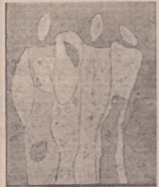
Xilografuri de Petru Petrescu (pag. 4 și 5)

și mă-ntreb dacă pe drumul peste care roți bucie au călcat sfărîindu-mi gîndul, și pe care pasi aud, omu-i cel ce se arată, fiară-i umbra care trece, ori cenușa mișcîndu-se pe coboară-ncet spre sud, dar hatoarele s-approve, mărgînind cu nepăsare în zăpezile calcate peste firele verzi, și pe maluri sălciile pleacă pînă dincolo de zare cum inclină brațe goale despre care-o vrea să spu- și fa marginea comunii fumează și-ndeamnă parcă în grămezi, gunoii putred ce așteaptă să-l arunci cu lopeti luat, în luna care stă ca o coșară și-ți aduce-aminte iarăși primăverile de-atunci. cite gînduri, cite umbre-n suferință vin de-avalma peste-o foaie de hirtie, cite-oud cum bat la uși,