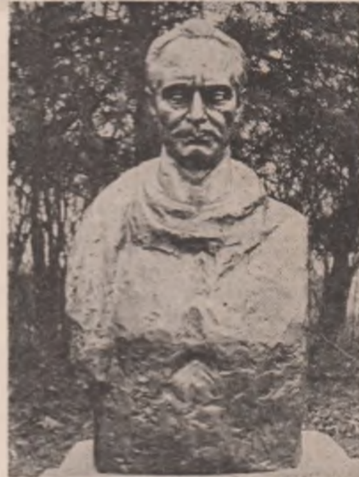
Sculptură de Mihai Coșan

„Retrospectiva” include poezii și prozatori români care „aspiră să înveștime sufletul românesc în haină europeană”. Informația autorului, de 34 ani, este bogată, transparentă, consecventă și preferențele artistice generoase, străine de intruziuni ideologice extraliterare. Imparțial și entuziast, Blaga exprimă unele înțuții critice, care prin concizie și substanță, de-