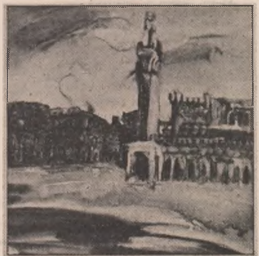
Tablouri de Viorela Mihăescu

Cînd bătea ceasul tragic, în care era implicată și țara noastră, publicul, lipsit de încredințări temeinice, își căuta o convingere de moment, la cafeana și în tramvai. În ajunul ultimului război, întrebam: „Exce-lență, cu cine mergem?” un eminent șef politic a răspuns zărilor consternați: „Cu cine dă mai mult”. Lumea și-a dat atunci seama că era de gol și de absent marelui bărbat de stat. E același bărbat care în calitate de ministru de finanțe, ca să se puie bine cu „Palatul” îi dăruise reginei un colier de mărghăritare, plătit o sută de mii de lei aur, din visterie. Caracteristic pentru epocă e și faptul că Majestatea sa feminină nu l-a refuzat.