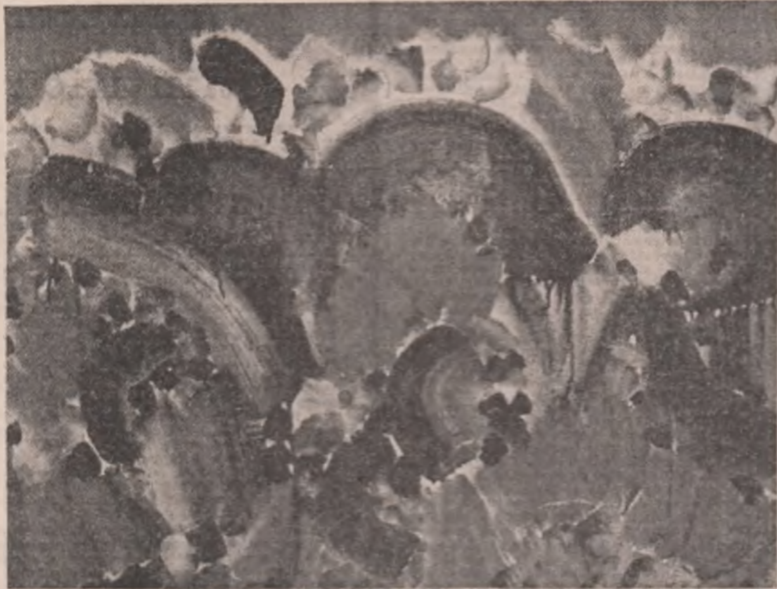
Tablouri de George-Paul Mihail