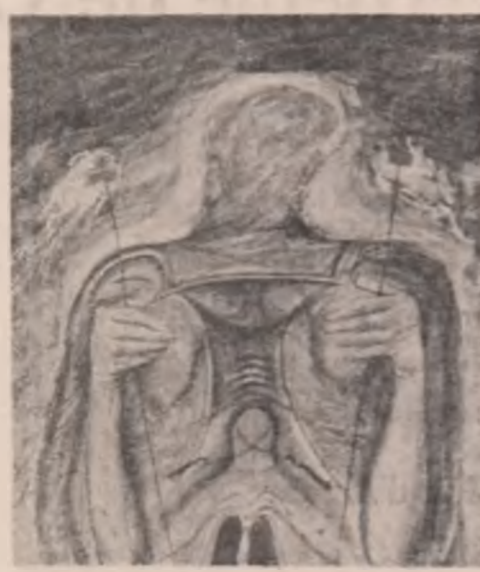
Tablouri de Dragoș Filip

Alergător singuratic pe plajă Cînd ziua iese din mare, cenușie, metalică, rece, Cînd pe nisipul greblat scilpesc mici obiecte uitate și scoici Și trupuri dorm în dezordine în hotel Expirînd orgia solară. Femeia se răsucește ușor sub cearceaf Ich liebe dich, ich liebe dich Copilul doarme pe micul pat de campanie, Bărbatul încovoiat pe saltea geme ușor Pictorul face portrete în somn, bătrînul A dormit în pijama pe mochetă. Miras de sudoare, de spray, de chiftele De vin, de bere, de piine Ca dintr-un strat de guano dimineața a scos Chipuri boțite, mirosuri, palide forme Marea lovește stabilizatori fantomatici Poartă trupuri de inecăți venind de pe apa Bosforului. Sint un alergător singuratic pe plajă Cînd ziua iese din mare, cenușie, metalică, rece.