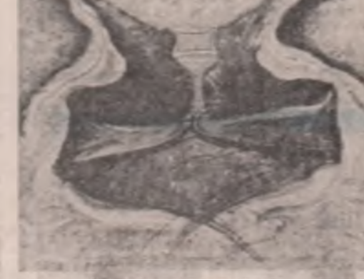
Tableau de Dragoș Filip

În interiorul imaginii ocrotitoare a satului eu dă dovadă de un cert vitalism juvenil. De aceea anoiimpul preferat este primăvara. Iar vîrsta clamată — adolescența. Cu alte cuvinte: puritate, avînt, entuziasm, reinnoare, pe alocuri chiar frereze: „toate împreună, expresii ale bîrînții idealului. Dar în exteriorul acestei imaginii ocrotitoare se întinde (bineînțeles) și spațiul agresiv și distructiv al orășului. Nu marea metropolă, ci orășul de provincie, hibrid, însă, totuși, citadin. Prin urmare, perversivitor. Iată-ne, deci, fată în față cu dichotomia sat / vîrș, mască a unui întreg sistem de opozitii: cultură vs civilizație, tradițional vs modern, esențial vs aparent, etic, mult, prea cunoscut pentru a mai analiza. Amintim doar că e vorba despre o tipică reacție etică la destrucțiunea valorilor (în literatura noastră dămărează de vreo 100 de ani). Noutatea, alii, e că orășul