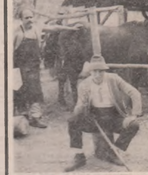
Victor Rebengiuc in „Poiana lui Iocan”