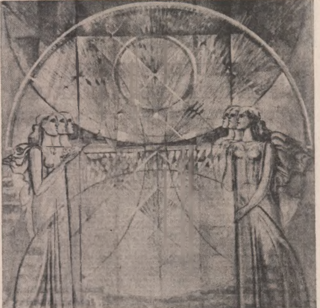
Grafică de Geta Mermese