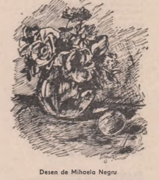
Desen de Mihaela Negru

Cette personne Persoana-aceia! Cite răutăți a înșirat: C-am fost din cale afar-de revoltat. Pe-mne fîrcecele de iarbă nu-s răutăcioș culcate Acolo am văzut tot lucruri care niciodată N-au zis în viața lor vreo răutate Și păsărici vioaie și nevinovate Mișcîndu-și tulpinile de mărăcini Aceste frunze or mai fi fiind? Și îmi ziceam: fiți-mi prietene mici păsărele fiți-mi amici fîrcele Fiți-mi prietene, voi mici furnici mititele.