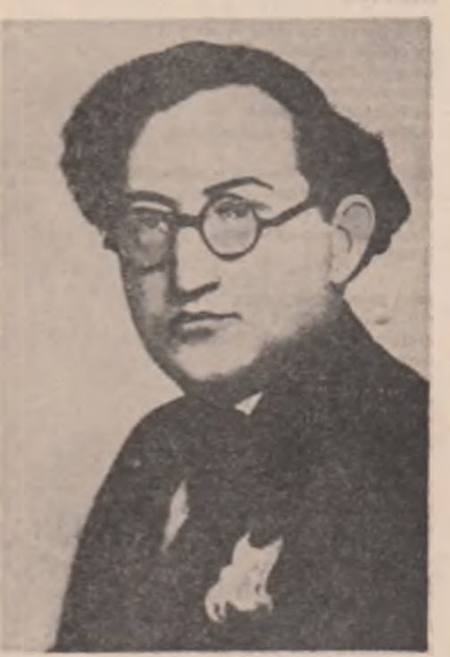
Gestul de refugiu sentimental în întimitatea acestor ființe îl apropie de Perpessicius de Ion Minulescu, de autorul jovielelor „Strofe pentru mine singur”.

P rintre manuscrisele lui Dumitru Paulescu Perpessicius aflate la Muzeul Literaturii Române am găsit un grupaj de poezii risipite pe diverse foliole volante. Ele datează din anii 1918-1925. Unele foi au tipărite pe ele anețelul Asociației generale a invalizilor din războiul României mari — Organ delegat al Ministerului Ocrotirilor sociale, altele snt cu anețelul Bibliotecii Facultății de Filozofie și Litere din București. Cele mai multe poezii snt scrise cu cerneală neagră, altele cu creionul negru. Se remarcă la toate efortul poetului de a scrie cu mîna stîngă, după dramaticul episod din viața sa: pierderea mîinii drepte în timpul luptelor de pe dealul Muratan din Dobrogea, unde luptase ca voluntar în primul război mondial. Poeziile poartă amprenta simbolismului național. Peisajul citadin va fi regăsit prin elementele de decor tipice: tramvai, asfalt, tîrg, fațade, cum se vor vedea în poezia Circuit, apoi freevența stărilor neurastenice din poezia Cette personne, în care predomină cuvintele: rătă, răutate, rătăcioasă, revoltate, în paralel cu imaginile poetice vitaliste ale plantelor și păsărilor. Ceea ce este specific poeziei perpessiciene este evaziunea într-un univers mirific, al flințelor mici, dar sociale. Păsări mici, furnici, ierburii, mărăcini, chiar — lor le cere prețenia.