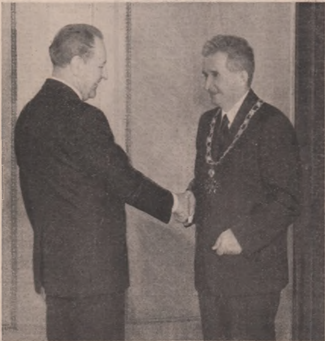
La invitația secretarului general al Partidului Comunist Român, tovarășul NICOLAE CEAUȘESCU, secretarul general al C.C. al Partidului Comunist din Cehoslovacia, tovarășul MILOŠ JAKES a efectuat o vizită prietenească de lucru în țara noastră. Desfășurată sub semnul dezvoltării ascendente a relațiilor de colaborare, vizită, prin convorbirile pe multiple planuri, se înscrie ca un nou capitol în cronica raporturilor româno-cesoslovace, în interesul ambelor popoare, al cauzei socialismului și păcii. Cu acest prilej, în semn de profundă prețuire și contribuție aduse la întărirea legăturilor de prietenie și colaborare româno-cesoslovace, a activității neobosite desfășurate pe plan mondial, pentru afirmarea idealurilor de pace, înțelegere și cooperare internațională, tovarășului Nicolae Ceaușescu i-a fost înmănat Ordinul „Leul Alb”, clasa I, cu colan, cea mai înaltă distincție de stat a Republicii Socialiste Cehoslovace.