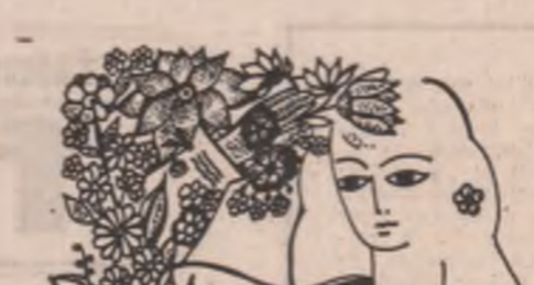
Desen de Raluca Grigoreca

Mi-am scos aparatul. Să vă fac o fotografie și d-voastră... și lui. Un tînr îmbrăcat cu relați și puoaică de muncitor, — de o lună a venit abia din facultate —: Peste cîțiva ani veți fi bogată cu fotografiile astea. O să vi le ceară toate ziarele și televiziunea. Fotografia este aici, mai mult ca orîndea, un document al unei singure zile. Cu ritmul nostru de lucru, dacă veniți mine, nu veți mai recunoaște locul, 250.000 tone de pămînt sînt strămutate în fiecare zi.