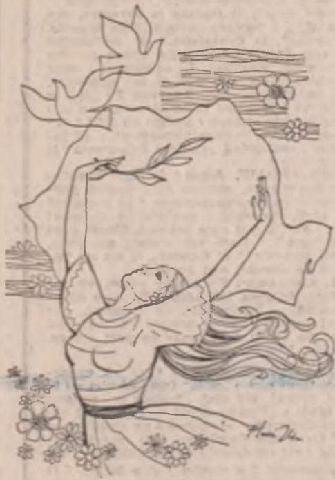
Ilustrație de Ilie Florin

ce îți deschide minile și pămîntul în preajma fulgerelor brațelor goale-ale ploii în preajma silexului mîinilor ploii în preajma cenului oricărei ființe a foamei există posibile punți tatuaje posibile punți între buzele mele și anul deschis al ochilor tăi peste liniile viei peste rare și-nălțimile roditoare există punți violente posibile de pămînt stăpînit ca ecurile