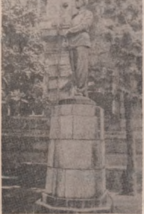
Statuia lui V.V. Maikovski din curtea gimnaziului la care a învățat

Sînt multe, involburate și năvalnice ca apele Rionului natal, care mă întîmpinaseră încă la întrearea în Kutaisi, impresii despre Maia- ikovski, copilul, unele sugerate indirect de lec- turi, altele culese la hălăduirea mea recentă de la