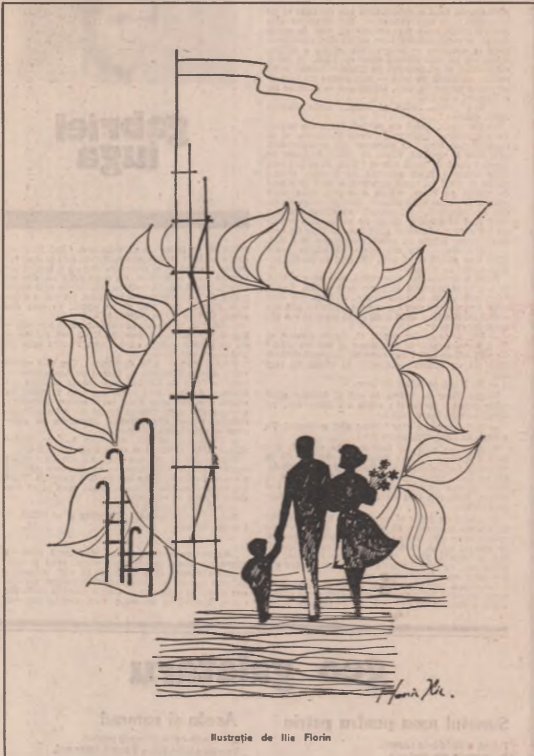
Ilustrație de Ilie Florin