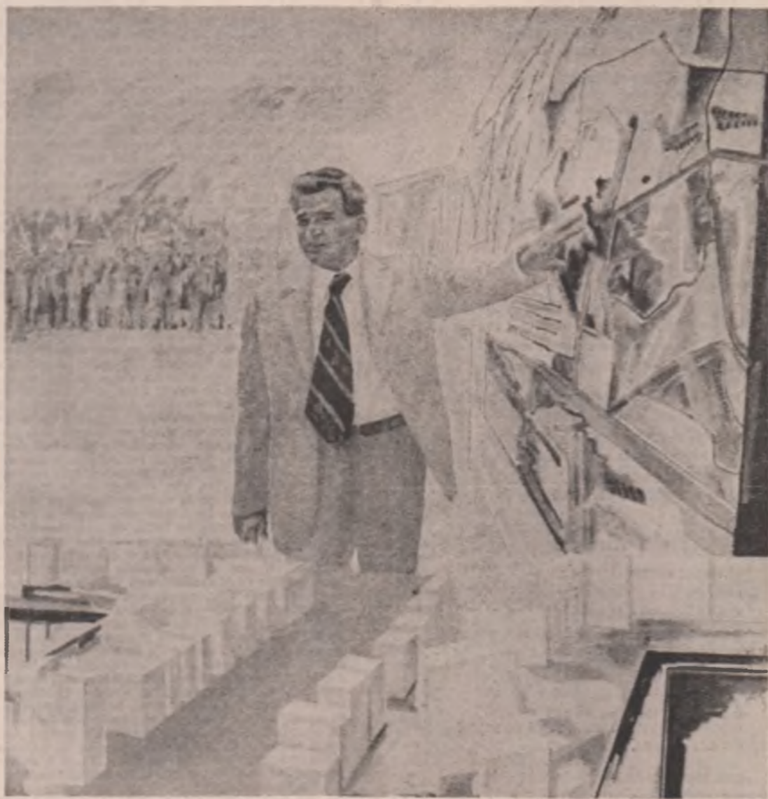
Tablou de Vladimir Șerban și Ion Bițan