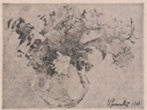
Tablouri de Vitalie Nereuț