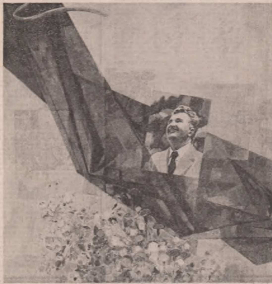
Tablou de Eftimie Medăciu