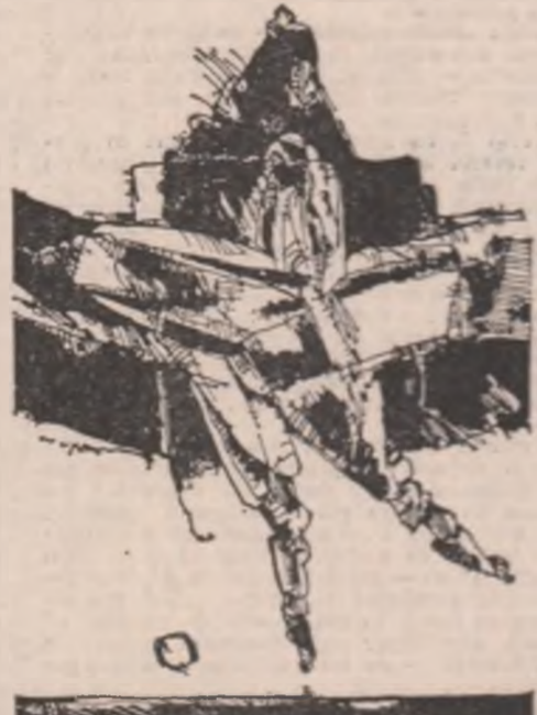
Grafică de Constantin Fohrib