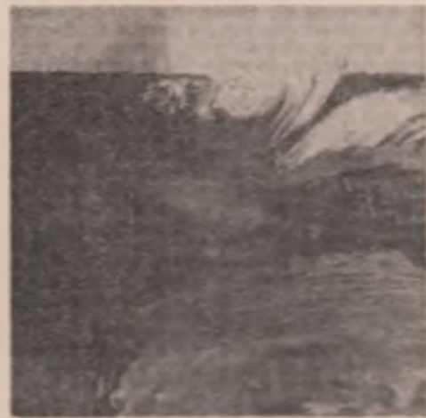
Tablouri de Silvia Pop