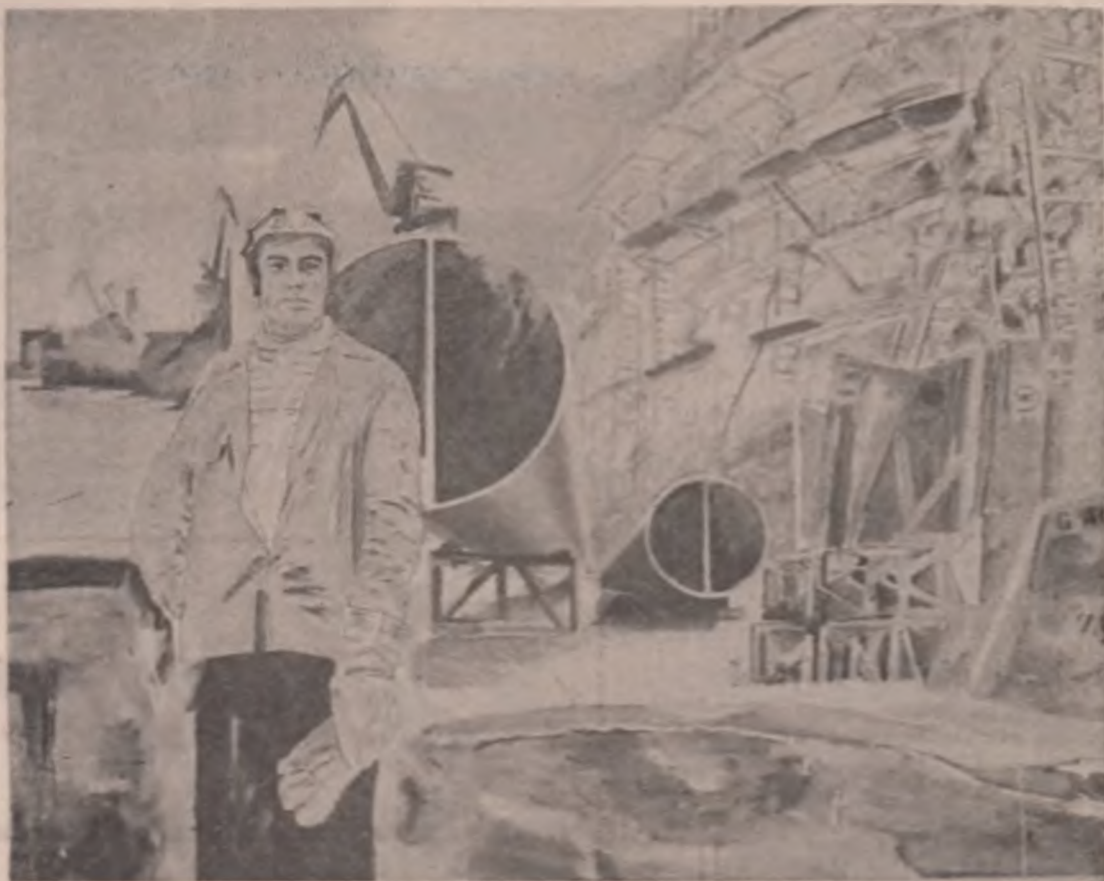
Tablău de Vladimir Șetron