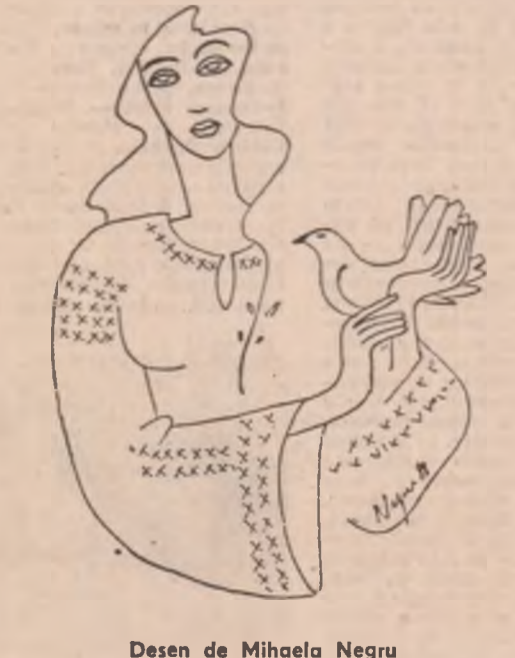
Desen de Mihaela Negru