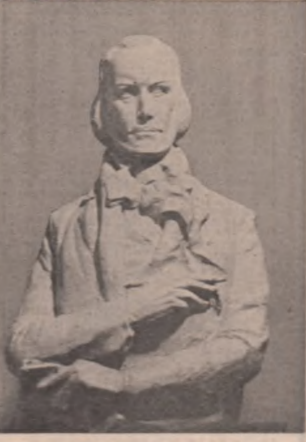
„Băcescu” - sculptura de Justin Năstase