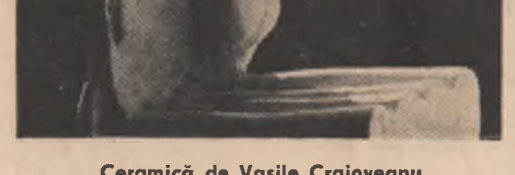
Ceramică de Vasile Craioveanu

La sfîrșitul celui de al doilea război mondial, Mihai Beniuc era un poet care-și dăduse măsura. Vocea lui sunase profetic, prevestind pericole și vorbind despre o lume nouă. A intrat în această lume cu toată energia și entuziasmul celui doritor de înnoire și de mai bine. Poetul legat de mase și dedicat lor, minutor al unei expresii pe cit de fruste pe cit de sugestive,