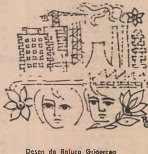
Desen de Raluca Grigoreca

Legînat în silabele tale etern, De cuvîntele „român”, „romănesc” nimic înima mea se deschide spre tine Ca o carte.