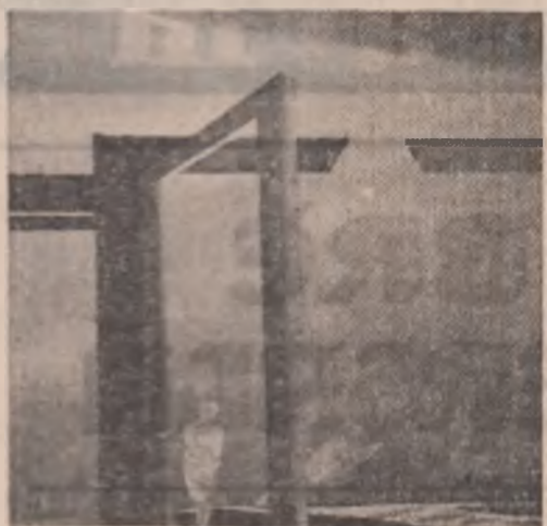
Tableaux de Rodica Petrescu