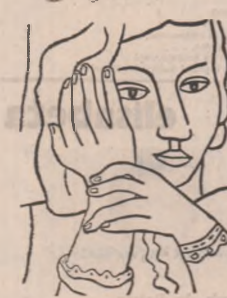
Desen de Fernand Leger