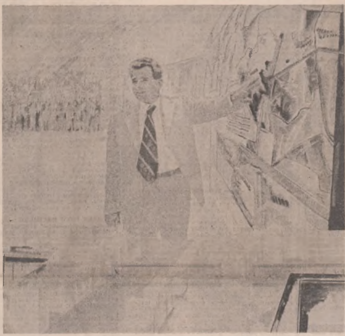
„Vizită de lucru” — tablou de Ion Bițan și Vladimir Șetran