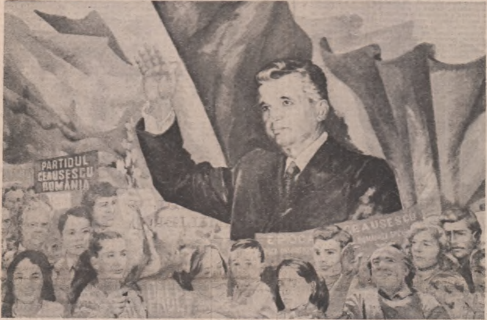
EPOCA NICOLAE CEAUȘESCU — tablou de Gheorghe Ioniță