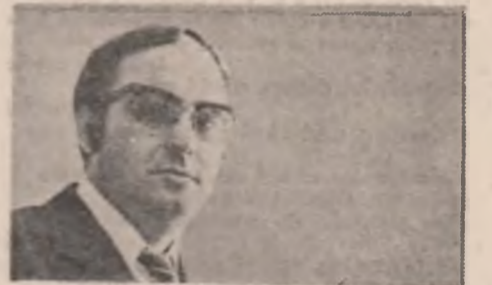
Se naște asemenea unui prunc din dragoste Și-o-ngemănătă încredere: viitorul e astfel...