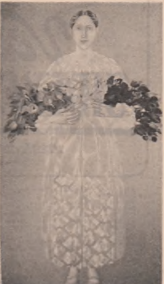
Tablou de Elena Greculesi