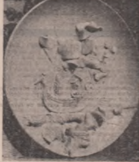
Ceramică de Costel Badea

în de tine însuși intrare limbiță opacă mişcare de sabie alunecând în teacă