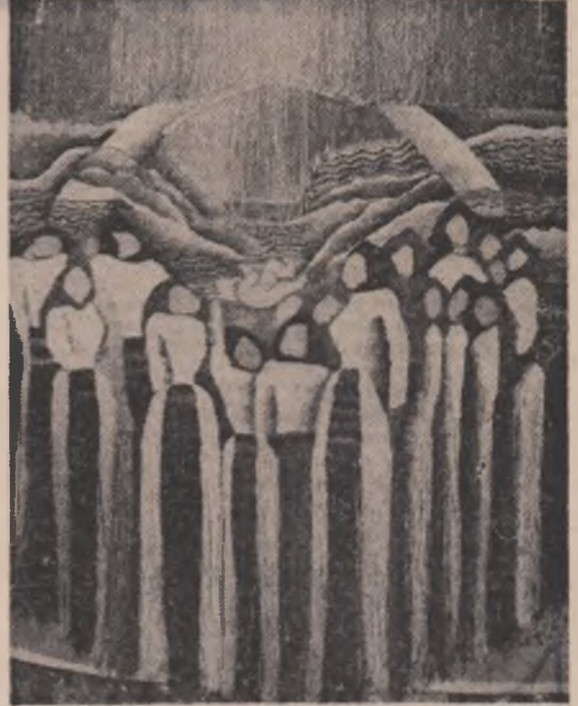
Tapiseria de Angela Ionilete