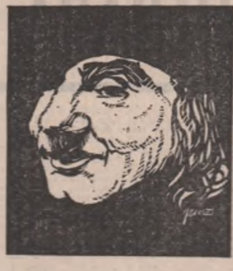
Desen de Florin Pucă