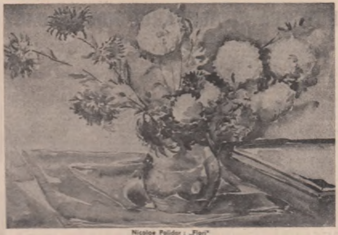
Nicolae Pădurar, „Flori”