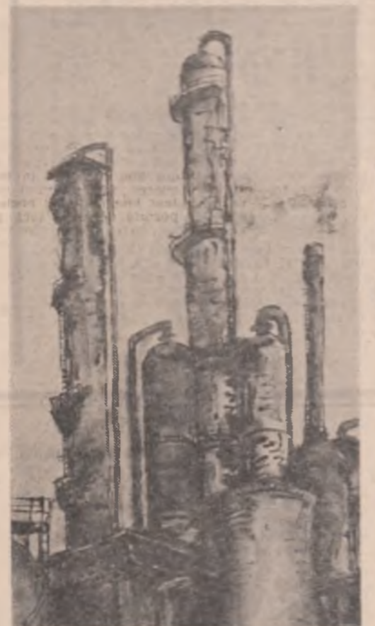
Otto Barabas-Teleojen, „Peisaj industrial”