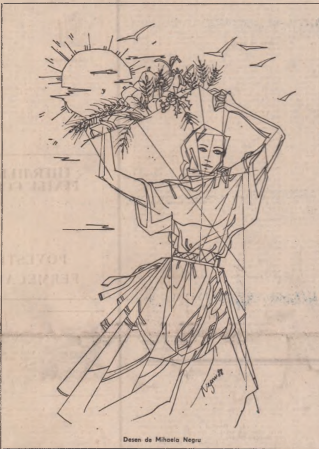
Desen de Mihaela Negru